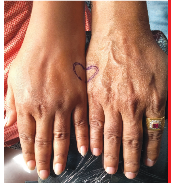
કપલ દ્વારા એકબીજાના ફોટા મુકીને લાગણી વ્યક્ત કરતા ફોટા પણ પોસ્ટ કરવામાં આવ્યા હતા.

પરંતુ આ વર્ષે થિએટર ખૂલ્યા છે સાથે કોરોનાનો ડર હજી ઓછો ન થયો હોવાથી થિએટરની જગ્યાએ શહેરીજનોએ ડ્રાઈવ પર જવાનો વિકલ્પ પસંદ કર્યો હતો. આ દિવસે અનેક શહેરીજનોએ વૃધ્ધાશ્રમની મુલાકાત લેવાનું સાથે દાન-પુણ્ય કર્યું હોવાનું પણ જણાયું હતું. આજના દિવસને ફક્ત એકબીજા માટે પ્રેમ વ્યક્ત કરીને નહિ પરંતુ સારા કાર્યો કરીને પણ શહેરીજનો દ્વારા મનાવવામાં આવ્યો હતો. આ ઉપરાંત સોશિયલ મિડીયામાં પણ શહેરના મોટાભાગના કપલ દ્વારા એકબીજાના ફોટા મુકીને લાગણી વ્યક્ત કરતા ફોટા પણ પોસ્ટ કરવામાં આવ્યા હતા.