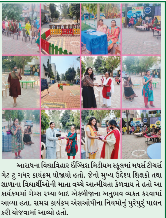
આરાધના વિદ્યાવિહાર ઈંગ્લિશ મિડીયમ સ્કૂલમાં મધર્સ ટીચર્સ ગેટ ટુ ગધર કાર્યક્રમ યોજાયો હતો. જેનો મુખ્ય ઉદ્દેશ શિક્ષકો તથા શાળાના વિદ્યાર્થીઓની માતા વચ્ચે આત્મીયતા કેળવાય તે હતો આ કાર્યક્રમમાં ગેસ્ટ રમ્યા બાદ એકબીજાના અનુભવ વ્યક્ત કરવામાં આવ્યા હતા. સમગ્ર કાર્યક્રમ એસઓપીના નિયમોનું પુરું પાલન કરી યોજવામાં આવ્યો હતો.