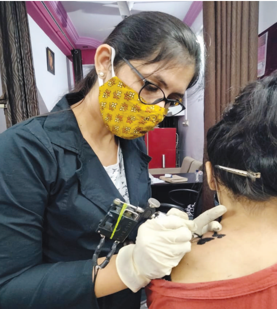
ગાંધીનગર, તા. ૧૪ આ વર્ષે વેલેન્ટાઈન ડેની ઉજવણી શહેરીજનો દ્વારા ખૂબ જ ઉત્સાહથી કરવામાં આવી.

એકબીજાને રોજ આપવા ઉપરાંત પાર્ટનર માટે ટેટુ બનાવડાવી, કેક કટ કરવા સાથે અનેક અવનવી રીતે શહેરીજનોએ વેલેન્ટાઈન ડે ઉજવ્યો