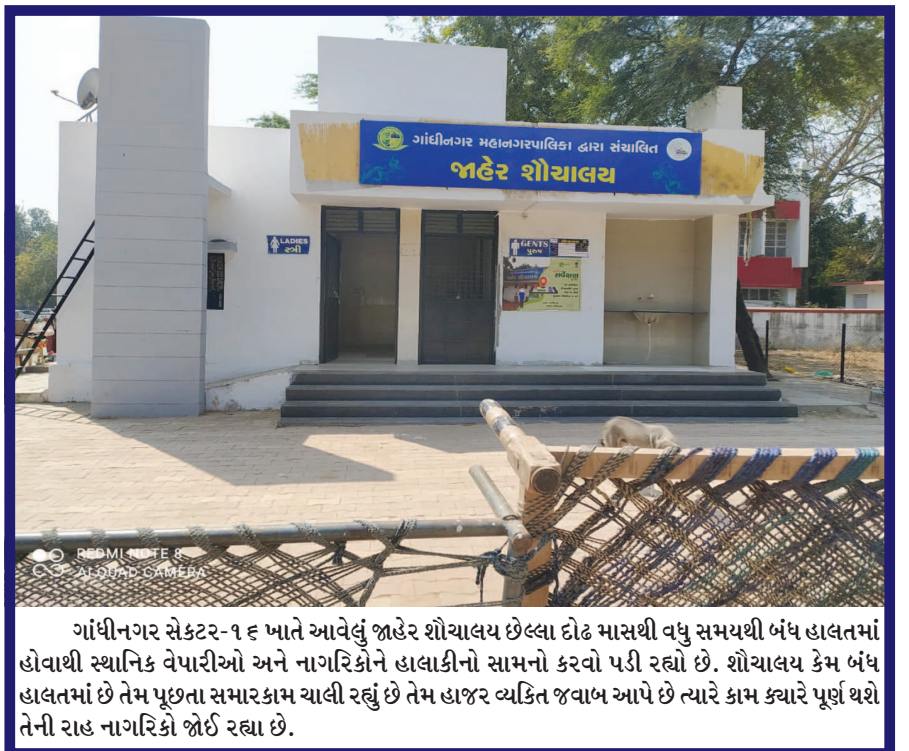
ગાંધીનગર સેક્ટર-૧૬ ખાતે આવેલું જાહેર શૌચાલય છેલ્લા દોઢ માસથી વધુ સમયથી બંધ હાલતમાં હોવાથી સ્થાનિક વેપારીઓ અને નાગરિકોને હાલાકીનો સામનો કરવો પડી રહ્યો છે. શૌચાલય કેમ બંધ હાલતમાં છે તેમ પૂછતા સમારકામ ચાલી રહ્યું છે તેમ હાજર વ્યક્તિ જવાબ આપે છે ત્યારે કામ ક્યારે પૂર્ણ થશે તેની રાહ નાગરિકો જોઈ રહ્યા છે.