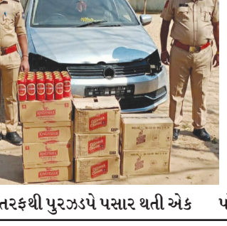
તરફથી પુરઝડપે પસાર થતી એક પોલીસે નંબર વગરની સિલ્વર

જોટાસણ નજીક ગાડીમાંથી દારૂ ઝડપી પાડયો : અંધારાનો લાભ લઈ આરોપી ફરાર હિંમતનગર તા. ૧૪ કોટડા ઘડી ચેકપોસ્ટ ખાતે વાહન ચેકિંગ દરમિયાન ખેરોજ પોલીસે કોટડા તરફથી આવી રહેલ ગાડીને ઉભી રાખવાનો પ્રયત્ન કરતા ગાડી ચાલકે લાંબીયા તરફ ગાડી ભગાડી મુકતા ગાડીનો પીછો કર્યો હતો ગાડીના ચાલકે ગાડી જોટાસણ નજીક આવેલ રાજસ્થાનના પાથર પાડી ગામ તરફ જવાના કાચા રસ્તે નાળિયામાં ઉતારી દઈ જંગલ વિસ્તાર તેમજ અંધારાનો લાભ લઈ પોતાની ગાડી મૂકી ભાગી ગયો હતો દરમિયાન પોલીસે નંબર વગરની સિલ્વર કલરની કુદાજ વેગન પોલો ગાડીની અંદર તપાસ હાથ ધરતા વિદેશી દારૂ તેમજ બિયર બોટલ નંગ- ૨-૩૦ કિલોગ્રામ રૂપિયા ૫૨૫૫૦/- નો મુદામાલ મળી આવ્યો હતો જે અનુસંધાને ખેરોજ પોલીસે ફરાર આરોપી વિરુદ્ધ ગુનો નોંધી કાયદેસરની કાર્યવાહી હાથ ધરી છે.