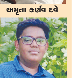
જેકર ધર્મ કલમેશ