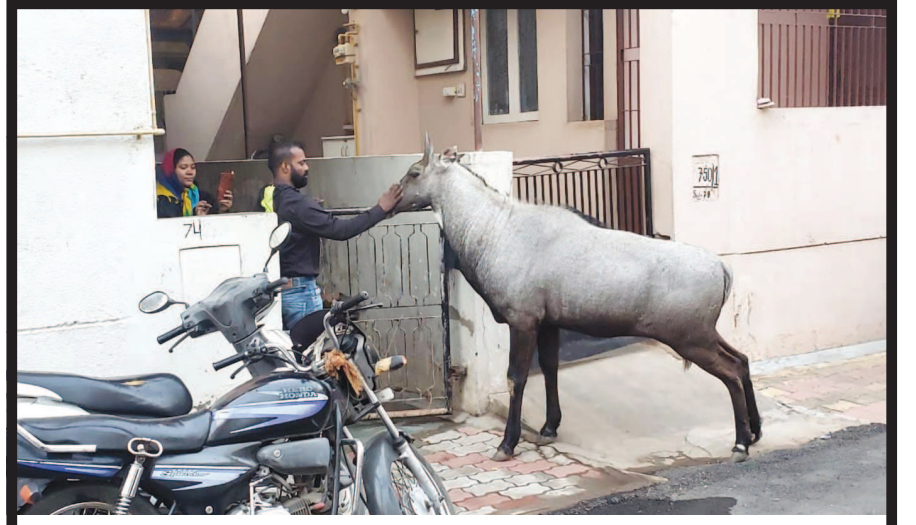
નીલગાય જંગલી પ્રાણી છે અને ગભરુ પ્રાણી છે. મોટે ભાગે તે જંગલ અને વગડામાં રહે છે. પરંતુ ગાંધીનગર શહેરની ગીચ વસ્તીમાં ઘણીવાર નીલગાય જોવા મળી જાય છે અહીં તેને જાણે ફાવી ગયું છે અને વસાહતીઓનો તેને કોઈ રંજાડ પણ નથી. સેક્ટર-૭માં અવારનવાર નીલગાય આવી ચઢે છે અને પાલતુ પ્રાણીની જેમ આરામથી વસાહતીઓના હાથે રોટલી-રોટલા ખાઈ લે છે.

જણાઈ રહ્યા છે. આજે ઘરની બહાર નીકળતા જ કારની વાત ન કરીએ તો પણ ટુ વ્હીલરનો કે જ તમામમાં છે. પબ્લિક ટ્રાન્સપોર્ટનો ઉપયોગ કરોના દરમિયાન વધુ થતો નથી ત્યારે પેટ્રોલના ભાવ વધતા શહેરના યુવાનો તથા મધ્યમવર્ગીય પરિવારો તો જાણે ટુંકા પગારમાં આ મોંઘવારી વધતા કેમ ગુજરાન ચલાવશે તે પ્રશ્ન બની રહ્યો છે.