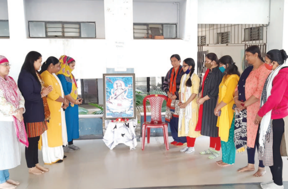
ગાંધીનગર ઈન્ટરનેશનલ પબ્લિક સ્કૂલ, રાંધેજ દ્વારા વસંતપંચમી નિમિત્તે મા સરસ્વતીની પૂજા અર્ચના કરીને ટ્રસ્ટીગણ તથા આચાર્ય અને શિક્ષકો દ્વારા શ્રધ્ધાપૂર્વક ઉજવણી કરવામાં આવી હતી.