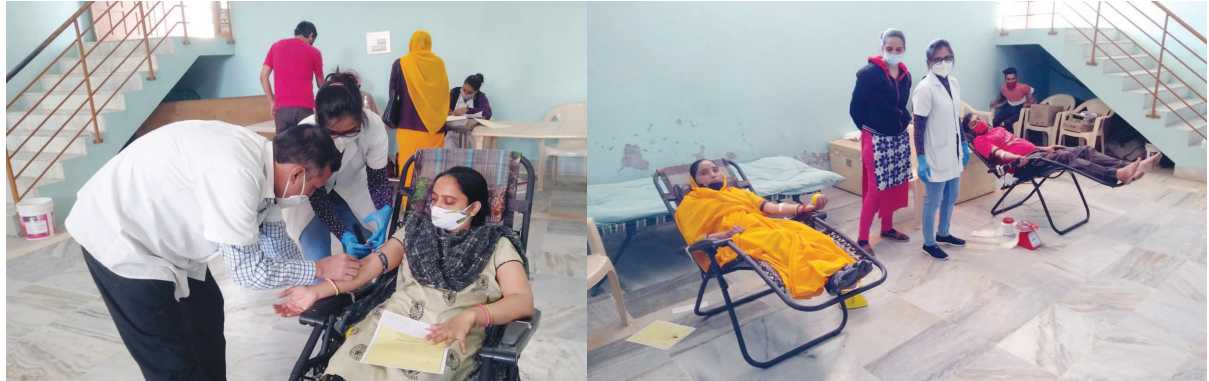
ગાયની પરિવાર સેક્ટર-૧ ખાતે રક્તદાન શિબિરનું આયોજન કરવામાં આવ્યું હતું. આ કેમ્પમાં ૨૪ બોટલ રક્ત એકત્ર થયું હતું.

પ્રમાણ વધ્યું છે. નવા વિકસિત ટી પી વિસ્તારમાં વિકાસના બદલાતા આયામો વચ્ચે રહેણાંક વધતા નવી સુવિધાઓ પણ ઉભી કરવામાં આવી રહી છે. ત્યારે એકબાજુ પાણી ગટરના કામોને પણ વેગ આપવા આયોજન કરાયું છે. ત્યારે વરસાદી પાણીના નિકાલની લાઈટ ઉપરાંત હવે સ્ટ્રીટ લાઈટની કામગીરી પણ હાથ ધરાશે. ત્યારે શહેરના તમામ સેક્ટરોમાં પણ સ્ટ્રીટ લાઈટના નવા થાંભલા નાંખવા માટે કામગીરી હાથ ધરાય તેવી માંગ પણ સ્થાનિકોમાં ઉઠવા પામી છે.