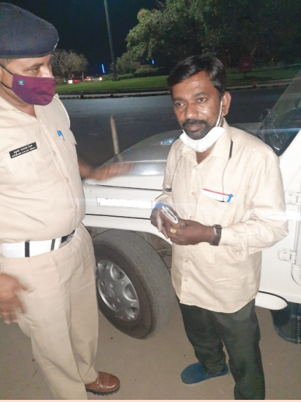
૧૩ હજાર રોકડાં રૂપિયા તેમજ અગત્યના કાગળો ભરેલું પર્સ ગઈકાલે રાત્રે કોબા સર્કલ પાસે પડી જવા પામ્યું હતું. આ પર્સમાંથી અગત્યના કાગળો સાથે ચલણી નોટો રોડ પર ઉડવા લાગી હતી જ્યારે તેના માલિકને તો ખબર જ નહોતી. આ સમયે ટ્રાફિક પોલીસે ઈમાનદારી અને કર્તવ્ય નિષ્ઠાનું ઉત્તમ ઉદાહરણ પૂરું પાડ્યું હતું અને ટ્રાફિક અટકાવી ઉડી રહેલાં નાણાં એકત્ર કરી તેના મૂળ માલિકનો સંપર્ક સાધી તેમને પર્સ પરત કર્યું હતું. જોકે પર્સમાં રહેલા ૩.૧૩ હજાર પૈકી ૩.૦૭ હજાર નો ડવાને કારણે ઉડી ગયા હતા પરંતુ ટ્રાફિક પોલીસની સત્કર્તાથી

ગાંધીનગર, તા. ૧૬ 'પોલીસ પ્રજાની મિત્ર' સૂચને ગાંધીનગર ટ્રાફિક પોલીસે સાર્થક કરતું કામ કર્યું હતું. અમદાવાદના નરોડા ખાતે રહેતા એક નાગરિકનું