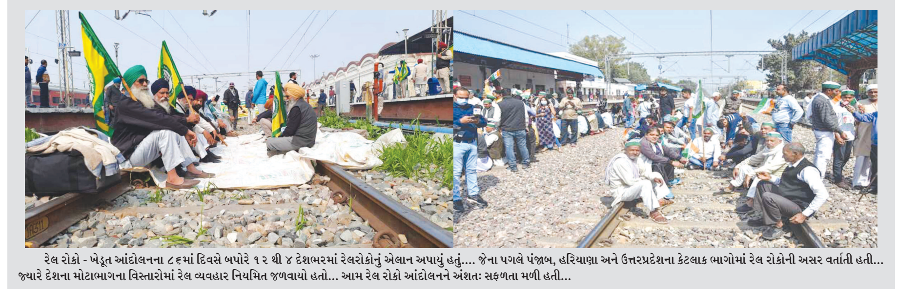
રેલ રોકો - ખેડૂત આંદોલનના ૮૬માં દિવસે બપોરે ૧૨ થી ૪ દેશભરમાં રેલરોકોનું એલાન અપાયું હતું... જેના પગલે પંજાબ, હરિયાણા અને ઉત્તરપ્રદેશના કેટલાક ભાગોમાં રેલ રોકોની અસર વર્તાતી હતી... જ્યારે દેશના મોટાભાગના વિસ્તારોમાં રેલ વ્યવહાર નિયમિત જળવાયો હતો... આમ રેલ રોકો આંદોલનને અંશતઃ સફળતા મળી હતી...

કરશે, તે વિજય યાત્રામાં દરમિયાન ઈ શ્રીધરન ભાજપમાં જોડાશે. મેટ્રો મેન ઈ શ્રીધરનની વાત કરીએ તો, તેઓ ૧૯૯૫થી ૨૦૧૨ સુધી દિલ્લી મેટ્રોના મેનિજિંગ ડાયરેક્ટર રહ્યાં હતાં અને દિલ્લી મેટ્રોની સફળતાનું શ્રેય તેમને જાય છે. જાહેર પરિવહન ક્ષેત્રે તેમના યોગદાન બદલ તેમને ભારત સરકારે વર્ષ ૨૦૦૮માં પદ્મ વિભૂષણ અને ૨૦૦૧માં પદ્મશ્રીથી સન્માનિત કર્યાં હતા.