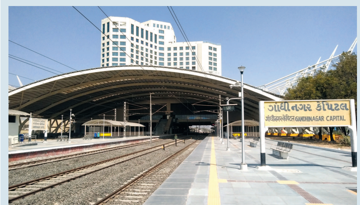
નવી ઓળખ - ગાંધીનગર શહેરની નવી ઓળખ સમાન નવા રૂપ-રંગ સાથે કેપીટલ રેલવે સ્ટેશન તૈયાર થઈ ચૂક્યું છે... ૭-૨૨૨ હોટલ સાથેનું રેલવે સ્ટેશન, ટેશનું પહેલું રેલવે સ્ટેશન બનશે... અદ્યતન સુવિધાઓ અને ટેશના તમામ રાજ્યોના પાટનગરો સાથે જોડતી ટ્રેનોને ગાંધીનગર મુકામે આવકારવા તૈયાર થયેલા પ્લેટફોર્મ શહેરનું એક આકર્ષણ બનશે... પાંચ દાયકાથી ગાંધીનગર અદ્યતન સ્ટેશન અને મહત્વની ટ્રેઈન સેવા માટે રાહત જોતું હતું... અંતે આ સ્વપ્ન સાકાર થઈ રહ્યું છે... આચારસંહિતાના અંત સાથે રેલવે સ્ટેશન ધમધમતું બની જશે...