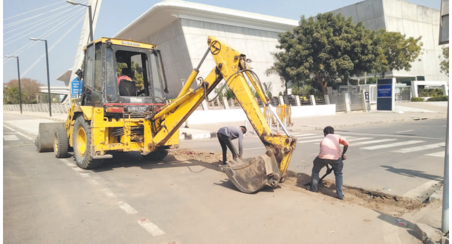
રાષ્ટ્રપતિ શ્રી રામનાથ કોવિદ ગુજરાતના મહેમાન બનવાના છે. ગાંધીનગર સ્થિત સેન્ટ્રલ યુનિવર્સિટીના પદવીદાન કાર્યક્રમમાં તેઓ હાજરી આપવાના હોવાથી સફાઈ તથા રોડ-રસ્તાની કામગીરી ચાલી રહી છે. તુટેલા રોડનું સિસ્કરેસીંગ હાથ ધરાયું છે તો ઠેર ઠેર સાફ સફાઈ પણ કરવામાં આવી રહી છે.

જેથી સિવિલમાં પુછતાછ કરતા સ્થાનિક ફાયરને મન દ્વારા ફાયર લાઈનની નોઝલની ચોરી કરી હોવાનું કબુલ્યું હતું. સિવિલના સત્તાધિશોએ ફાયર મેનને તાત્કાલીક અસરથી નોકરીમાં પાછો પુર પકડાવી દીધું છે. જ્યારે ગોકુળપુરાના ભંગારના વેપારી પાસેથી ૧૪ નોઝલ કબ્જે લીધી હતી. ઉલ્લેખનીય છે કે જાગૃત નાગરીકના પગલે સમગ્ર નોઝલ ચોરીનું કૌભાંડ સામે આવ્યું છે. ત્યારે સિવિલમાંથી નાની મોટી અનેક નાન મેડીકલ અને મેડીકલ ચીજવસ્તુઓનો જથ્થો બારોબાર પથરાવી દેવામાં આવે છે. જેમાં સ્ટાફના કેટલાક કર્મચારીઓની મિલિભગત હોવાનું પણ જાણવા મળી રહ્યું છે.