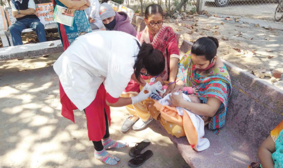
આરોગ્ય અને પરિવાર કલ્યાણ વિભાગ દ્વારા બાળકોને કૃમિનાશક દવાનું વિતરણ કરવામાં આવી રહ્યું છે. સેક્ટર-૫ સી ખોડિયાર મંદિર ખાતે કૃમિનાશક દવા આપવામાં આવી રહી છે.