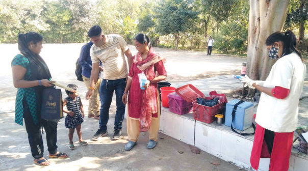
આરોગ્ય અને પરિવાર કલ્યાણ વિભાગ દ્વારા બાળકોને કૃમિનાશક દવાનું વિતરણ કરવામાં આવી રહ્યું છે. સેક્ટર-૫ સી ખોડિયાર મંદિર ખાતે કૃમિનાશક દવા આપવામાં આવી રહી છે.

ગાંધીનગર, તા. ૨૫ આગામી તા. ૨૮ ફેબ્રુઆરીના રોજ સ્થાનિક સ્વરાજ્યની ચૂંટણીનું મતદાન યોજાનાર છે. ત્યારે અંતિમ તબક્કામાં ઉમેદવારો દ્વારા ચૂંટણી પ્રચાર તેજ કરી દેવાયો છે. ચૂંટણી જીતવા માટે ઉમેદવારો એડીઓટીનું જોર લગાવી રહ્યા છે. ત્યારે ગાંધીનગર જિલ્લા પંચાયતની ૨૮ બેઠકો, તાલુકા પંચાયતની ૭૦ વોર્ડના ૨૮ અને માણસા નગરપાલિકાની ૨૮ બેઠકો, તે ઉપરાંત કલોલ નગરપાલિકાની ૧૧ વોર્ડની ૪૪ બેઠકો અને હેહગામ નગરપાલિકાની ૭ વોર્ડના ૨૮ અને માણસા નગરપાલિકાની ૨ બેઠકો રવિવારના રોજ મતદાન યોજાશે. ત્યારે સ્થાનિક સ્વરાજ્યની ચૂંટણીઓમાં મતદાન મથક ખાતે કાયદો અને સલામતીની વ્યવસ્થા જાળવઈ રહે તે માટે જિલ્લાના ૯૬૭ મતદાન મથક પર ૨૧૦૦ થી વધુ પોલીસ જવાનો અને હોમગાર્ડના કર્મચારીઓ ફરજ પર તૈનાત રહેશે. જિલ્લા પોલીસવડા મયુર યાવડાના માર્ગદર્શન હેઠળ મતદાનના દિવસે પ ડીવાયએસપી, ૧૦ પીઆઈ, ૫૩ પીએસઆઈ, ૯૧૦ પોલીસ જવાનો સહિત ૧૩૬૮ હોમગાર્ડ વિવિધ સ્થળ પર ફરજ બજાવશે. જયારે કાયદો અને વ્યવસ્થાની સ્થિતિ જાળવઈ રહે તે માટે મતદાન સમયે સતત પોલીસ પેટ્રોલીંગ કરવામાં આવશે. જિલ્લામાં કુલ ૫૨૪ જેટલી બિલ્ડિંગમાં ૯૬૭ મતદાન મથકો ઉભા કરવામાં આવ્યા છે. જેમાં ૧૩૮ બુથ અને ૫૮ બિલ્ડિંગ અતિ સંવેદનશીલ, ૨૪૭ બુથ, ૧૧૫ બિલ્ડિંગ સંવેદનશીલ તેમજ ૫૮૨ બુથ, ૩૫૦ બિલ્ડિંગ સામાન્ય ચે. ત્યારે સંવેદનશીલ અને અતિ સંવેદનશીલ મતદાન કેન્દ્રો પર સલામતીનું ખાસ ધ્યાન રાખવામાં આવી રહ્યું છે.