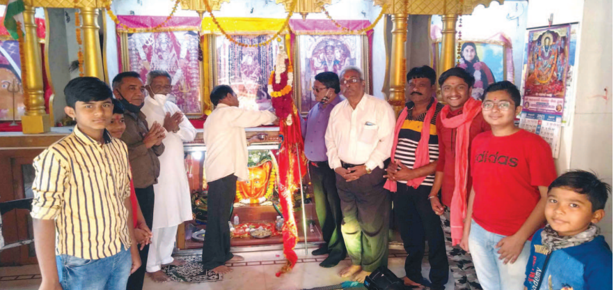
ખોડિયાર મંદિર, રાજપરા ભાવનગર ખાતે ધજારોહણ માટે દર વર્ષે પગપાળા સંઘ પેશાપુરથી જાય છે. આ વર્ષે ૫૦ ભાવિક ભક્તો પગપાળા સંઘમાં જોડાયા છે. આ સંઘ સેક્ટર-૫ સી ખાતે આવી પહોંચતા સેક્ટર-૫ના ખોડિયાર મંદિર ખાતે સંઘનું ભવ્ય સ્વાગત કરવામાં આવ્યું હતું.

અથવા ચાલવા માટે જતાં અહીંના વચસ્ક વડીલોને પગપાળા આવન જાવન કરવી જોખમી બની છે જેમાં તેમના પડી જઈને ઈજાગ્રસ્ત થવાનું જવાનું જોખમ રહેલું છે.