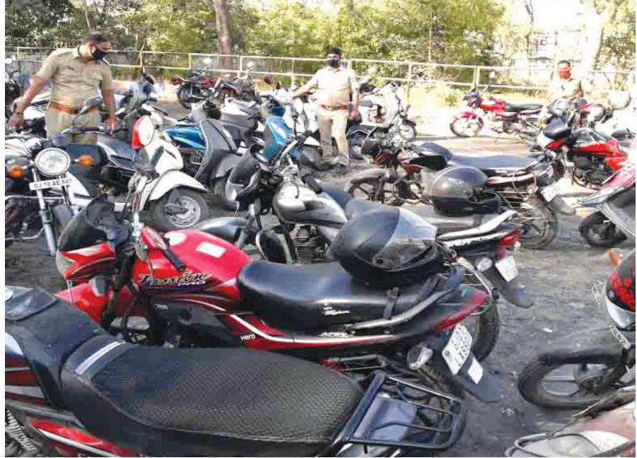
ગાંધીનગર એસ.ટી. રૂપો ખાતે મુસાફરો ગમે તેમ વાહનો પાર્ક કરીને જતાં રહે છે. ટ્રાફિક પોલીસે નવતર પ્રયોગના ભાગ રૂપે અહીં પાર્ક કરેલ લોક ક્યા વગરના વાહનોને કબ્જે લીધા હતા. આ રીતે મુસાફરોને જાગૃત કરવાનો પ્રયાસ કરવામાં આવ્યો હતો.

આ ઉપરાંત પહેલા રસના મશીનમાંથી શેરડીનો રસ કાઢતા ત્યારે એજ તપેલી આખો દિવસ ચાલતી પરંતુ હવે દર વખતે તપેલી કે લાગતાવળગતા તમામ વાસણને ધોઈને જ બીજી વખત રસ કઢાય છે અને વેપારીઓ પોતાના હાથ હેન્ડગ્લોસ પર વારા ધરીયે કરતા રહે છે જેથી કસ્ટમર રસ પીતા ખચકાય નહિ. શેરડીના રસના એક ગ્લાસનો કિંમત ભાવ હાલ ૨૦ રૂ. શહેરમાં છે. દિવસના ૧૨ સુધી અને સાંજથી મોડી રાત સુધી શેરડીનો રસ પીવાની મજા માણી રહ્યા હોય છે.