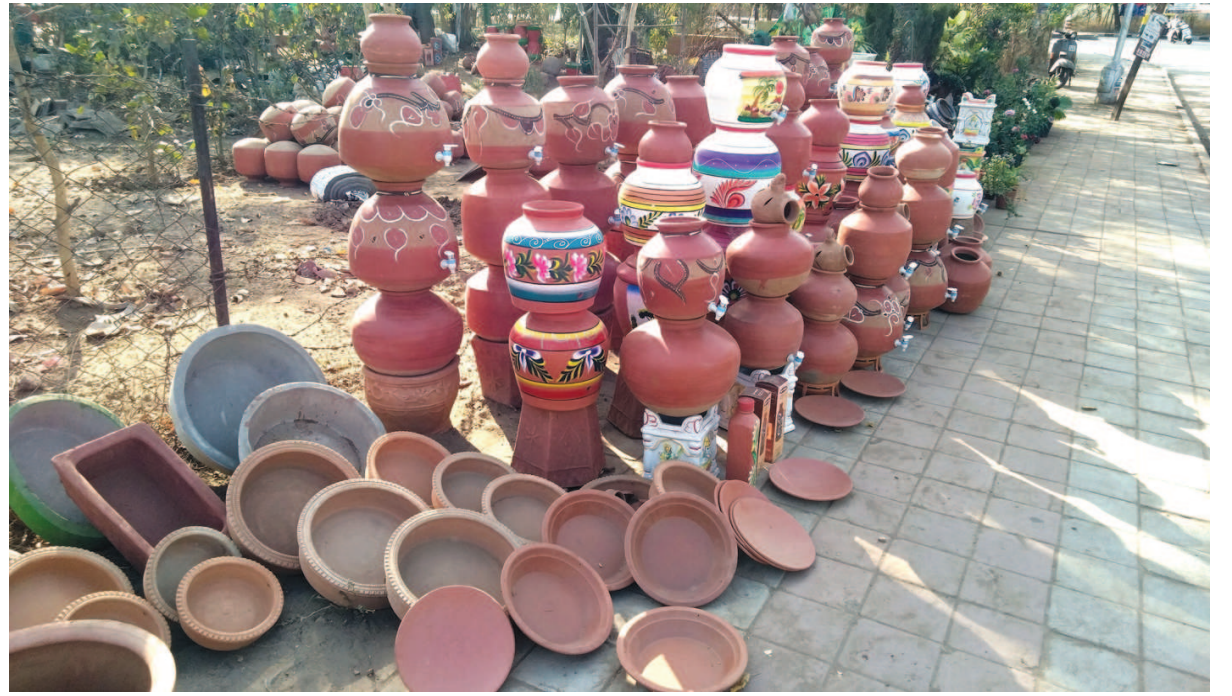
ઉનાળો ધીમે ધીમે તેની અસર દેખાડવા માંડ્યો છે. અત્યાર સુધી યાદ ન આવેલું ઠંડુ પાણી હવે યાદ આવવા માંડ્યું છે. દેશી કિચ્છ કહેવાતા માટલાનું વેચાણ છેલ્લા કેટલાક દિવસોથી વધ્યું છે. મુખ્ય માર્ગોની આસપાસ વિવિધ પ્રકારના માટલા વેચાઈ રહ્યા છે. આ ઉપરાંત ગરમીમાં ઠંડક પહોંચાડતી લીલી-કાળી દ્રાક્ષ તેમજ રસભર્યા તરબૂચનું વેચાણ પણ વધી રહ્યું છે.

ભણવા દેવાઈ ગયા છે માટે હવે શાળાએ મોકલી એમને ટેન્શનમાં નથી મુકવા. પરીક્ષા વખતે આમ પણ બાળકોને પરીક્ષાનો હાઉ હોય છે અને ઉપરથી કોરોનાનો હાઉ બાળકોને આપવો નથી. માટે અમે ઈચ્છીએ છીએ કે આ સત્રની પરીક્ષા ઓનલાઈન જ થાય અને આવનાર સત્ર એટલે કે જૂન-જુલાઈ માસથી શરૂ થતા નવા સત્રથી અમે બાળકોને શાળાએ મોકલીશું. બાળકો પણ અગ્રિલ-મે માસનું વેકેશન માણી નીડર રીતે જૂન જુલાઈમાં હાજર થાય એનો અમને વાંધો નથી.