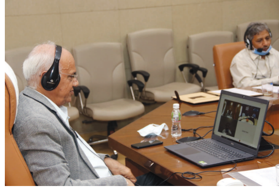
રાષ્ટ્રીય સહકારી સંચાલન સંસ્થા, પૂણે (VAMNICOM)ના ડાયરેક્ટર ડૉ. કે. કે. ત્રિપાઠી

જણાવ્યું હતું કે આ સમજૂતી કરાર બંને કેન્દ્ર સરકારની સંસ્થાઓ વચ્ચે અદિતીય તાલીમ કાર્યક્રમ, અધ્યાપક-અભ્યાસક્રમ આદાન-પ્રદાન, પ્રકાશનની સાથોસાથ શિક્ષણ અને સંશોધન ક્ષેત્રે ઉચ્ચ કક્ષાનું કૌશલ્ય વિકસિત કરવામાં સહાયક બનશે. અત્યારે દેશમાં દોઢ લાખ કરતાં વધુ કો-ઓપરેટિવ સોસાયટી છે અને VAMNICOM એ ભારત સરકારનું પૂણે સ્થિત એકમાત્ર તાલીમ કેન્દ્ર છે. જ્યાં દેશ-વિદેશ સ્થિત બેંક, સુગર ફેક્ટરી, માર્કેટિંગ સોસાયટી અને સહકારી સંસ્થાઓના કર્મચારી-અધિકારીઓનું પ્રશિક્ષણ થાય છે.