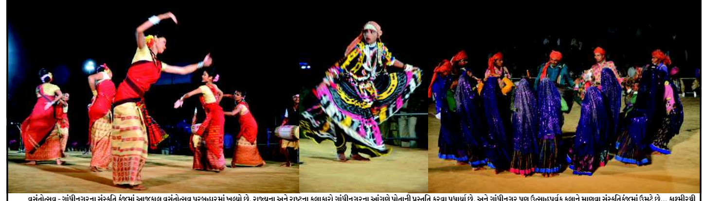
વસંતોત્સવ - ગાંધીનગરના સંસ્કૃતિ કુંજમાં આજ કાલ વસંતોત્સવ પૂર્ણબહારમાં ખૂલ્યો છે. રાજ્યના અને રાષ્ટ્રના કલાકારો ગાંધીનગરના આંગણે પોતાની પ્રસ્તુતિ કરવા પધાર્યા છે. અને ગાંધીનગર પણ ઉત્સાહપૂર્વક કલાને માણવા સંસ્કૃતિ કુંજમાં ઉમટે છે... કામગીરીથી કન્યાકુમારી અને કચ્છથી કટક સુધીના કલાકારો આજ કાલ ગાંધીનગરમાં છે. ગાંધીનગરનું આંગણું કલાના અભિષેકથી વધુ વાયુબળત બની રહ્યું છે.