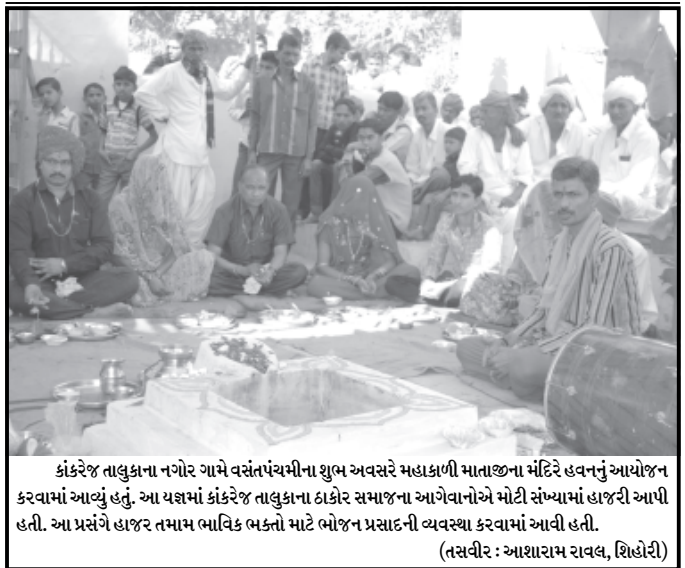
કંકરેજ તાલુકાના નગર ગામે વસંતપંચમીના શુભ અવસરે મહાકાળી માતાજીના મંદિરે હવનનું આયોજન કરવામાં આવ્યું હતું. આ યજ્ઞમાં કંકરેજ તાલુકાના ઠાકોર સમાજના આગેવાનોએ મોટી સંખ્યામાં હાજરી આપી હતી. આ પ્રસંગે હાજર તમામ ભાવિક ભક્તો માટે ભોજન પ્રસાદની વ્યવસ્થા કરવામાં આવી હતી.

ડીસા નગરપાલિકાના વોર્ડ નં. ૨ની ખાલી પડેલ બેઠક માટે રવિવારે પેટા ચૂંટણી યોજાઈ હતી. જેમાં લગ્નની સિડન તેમજ મતદારોમાં