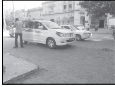
લૂંટના ગુનામાં આરોપીઓને ઝડપી લાગી હતી. મુંબઈ પોલીસે આજે આ

પાલનપુર, તા. ૪ મુંબઈના કુર્લા વિસ્તારમાં એક જ્વેલર્સની દુકાનમાં થયેલી ત્રણ કરોડની સનસાટી ભરી લૂંટની તપાસ કરતી મુંબઈ પોલીસને પગે પાલનપુરમાં મળી આવતા મુંબઈ પોલીસે પાલનપુરમાં ધામા નાંખ્યા હતા. દરમિયાન, આજે મુંબઈ પોલીસે પાલનપુરમાંથી ત્રણ આરોપીઓને મુદામાલ સાથે ઝડપી લેતા ચક્રવાર મચી જવા પામી હતી. મુંબઈના કુર્લા વિસ્તારમાં આવેલી એક જ્વેલર્સની દુકાનમાં જ ૩૦મી તારીખે ૨.૮૯ કરોડની સનસાટીભરી લૂંટ થઈ હતી. જે ગુનાનો ભેદ સી.સી.ટી.વી. કુટેજના આધારે