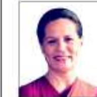
શ્રીમતી સોનિયા ગાંધી