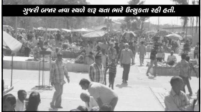
ગુજરી બજાર નવા સ્થળે શરૂ થતા ભારે ઉત્સુકતા રહી હતી.