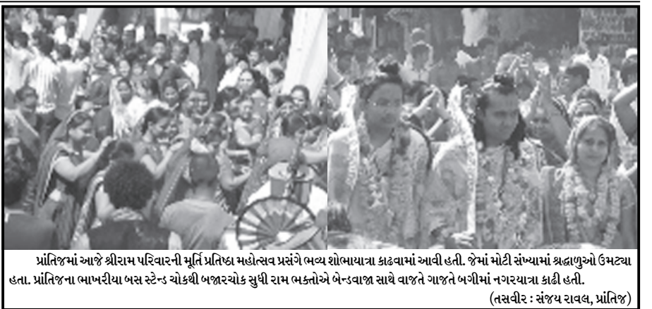
પ્રાંતિજમાં આજે શ્રીરામ પરિવારની સૂત્રિ પ્રતિષ્ઠા મહોત્સવ પ્રસંગે ભવ્ય શોભાયાત્રા કાઢવામાં આવી હતી. જેમાં મોટી સંખ્યામાં શ્રદ્ધાળુઓ ઉમટ્યા હતા. પ્રાંતિજના ભાખરીયા બસ સ્ટેન્ડે ચોકઠી બજારચોક સુધી રામ ભક્તોએ બેન્ડવાજ સાથે વાજતે ગાજતે બગીમાં નગરયાત્રા કાઢી હતી.