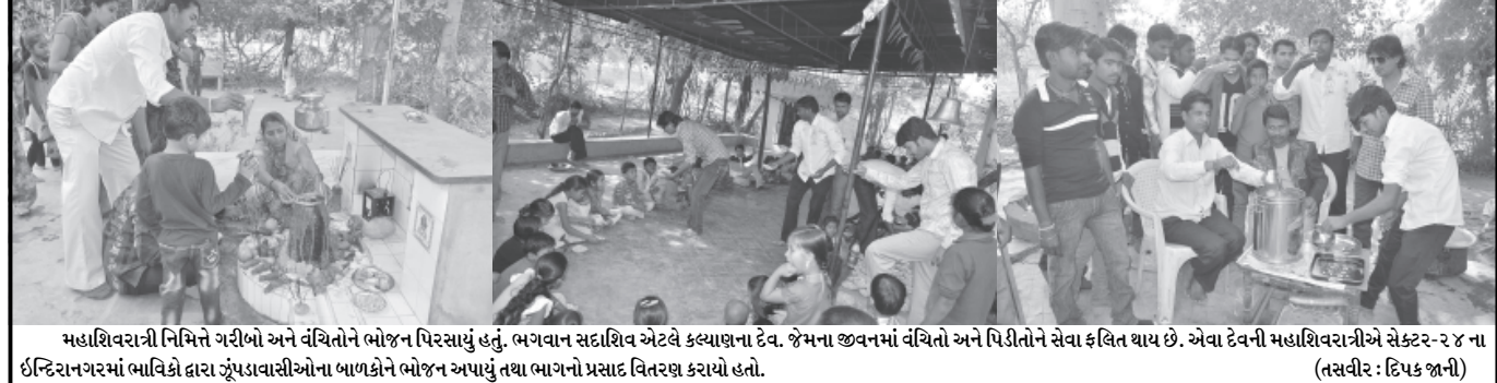
મહાશિવરાત્રી નિમિત્તે ગરીબો અને વંચિતોને ભોજન પિરસાયું હતું. ભગવાન સદાશિવ એટલે કલ્યાણના દેવ. જેમના જીવનમાં વંચિતો અને પિડીતોને સેવા ફલિત થાય છે. એવા દેવની મહાશિવરાત્રીએ સેક્ટર-૨૪ ના ઈન્દિરાનગરમાં ભાવિકો દ્વારા ઝૂંપડાવાસીઓના બાળકોને ભોજન અપાયું તથા ભાગનો પ્રસાદ વિતરણ કરાયો હતો.

ગાંધીનગર, તા. ૨૭ ગાંધીનગર શહેર નાગરિક સંરક્ષણ એકમ (સીવીલ ડિકેન્સ)ના તમામ વોર્ડન અને પદાધિકારીઓની માસિક બેઠક તા. ૨૮ મી ફેબ્રુઆરીના સાંજે ૫.૦૦ સીવીલ ડિકેન્સ કચેરી ખાતે રાખવામાં આવેલ છે. ચીફ વોર્ડનશ્રી જણાવેલ છે.