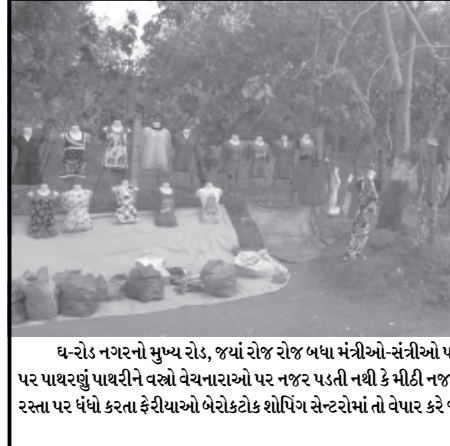
ધ-રોડ નગરનો મુખ્ય રોડ, જ્યાં રોજ રોજ બધા મંત્રીઓ-સંત્રીઓ પસાર થાય છે. છતાં ધ-પાસે ફૂટપાથ પર પાથરણું પાથરીને વચો વેચનારાઓ પર નજર પડતી નથી કે મીટી નજર એ તો અધિકારીઓ જ જાણે. જાહેર રસ્તા પર ધંધો કરતા ફેરીયાઓ બેરોકટોક શોપિંગ સેન્ટરોમાં તો વેપાર કરે જ છે. હવે તો મુખ્ય રસ્તાઓ પર પણ?

મોબાઈલ ક્વરથી માંડીને વાસણો સુધીના વિવિધ ચીજ વસ્તુઓના સ્ટોલ અને પાયરણાએ આકર્ષણ જમાવ્યું હતું. આ વખતે અનોખી સીએનજી રીક્ષાના સ્વરૂપની ચક્રોળે બાળકો સહિત મોટેરાઓનું પણ મન લોભાવ્યું હતું. પંચદેવ મંદિર અને નજીકમાં આવેલ વેજનાથ મહાદેવ મંદિરને ઢાથ સાફ કર્યા હતા. અમદાવાદથી ખાસ આ મેળો માણવા આવેલ દંપતિનો મોબાઈલ ચોરાતા તેઓ નિરાશ થઈ મેળો માણવા વગર તુરંત જ પાછા વળી ગયા હતા. પંચદેવ મંદિર ઉપરાંત ગાંધીનગરની પાદરે આવેલા ધોળેશ્વર મંદિરે પણ પરંપરાગત રીતે ભરાતા અભિષેક યોજાયો હતો.