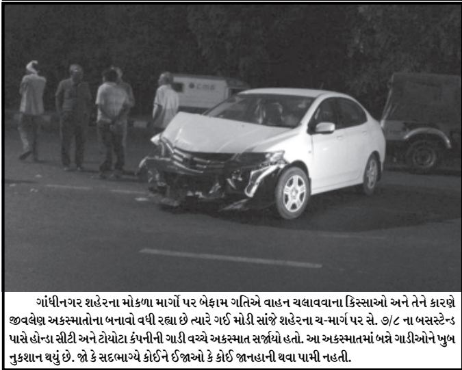
ગાંધીનગર શહેરના મોકળા માર્ગો પર બેકામ ગતિએ વાહન ચલાવવાના કિસ્સાઓ અને તેને કારણે જીવલેણ અકસ્માતોના બનાવો વધી રહ્યા છે ત્યારે ગઈ મોડી સાંજે શહેરના ચ-માર્ગ પર સે. ૭૮ ના બસસ્ટેન્ડ પાસે હો-ના સીટી અને ટોયોટા કંપનીની ગાડી વચ્ચે અકસ્માત સર્જાયો હતો. આ અકસ્માતમાં બંને ગાડીઓને ખુબ નુકશાન થયું છે. જો કે સહભાગ્યે કોઈને ઈજાઓ કે કોઈ જાનહાની થવા પામી નહતી.