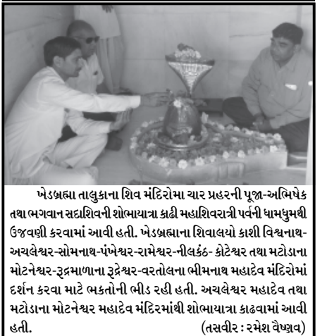
ખેડબ્રહ્મા તાલુકાના શિવ મંદિરોમાં ચાર પ્રહરની પૂજા-અભિષેક તથા ભગવાન સદાશિવની શોભાયાત્રા કાઢી મહાશિવરાત્રી પર્વની ધામધૂમથી ઉજવણી કરવામાં આવી હતી. ખેડબ્રહ્માના શિવાલયો કાશી વિશ્વનાથ અચલેશ્વર-સોમનાથ-પંખેશ્વર-રામેશ્વર-નીલકંઠ-ક્રોટેશ્વર તથા મટોડાના મોટેશ્વર-રૂદ્રમાળાના રૂદ્રેશ્વર-વરતોલના ભીમનાથ મહાદેવ મંદિરોમાં દર્શન કરવા માટે ભક્તોની ભીડ રહી હતી. અચલેશ્વર મહાદેવ તથા મટોડાના મોટેશ્વર મહાદેવ મંદિરમાંથી શોભાયાત્રા કાઢવામાં આવી હતી. (તસવીર : રમેશ વૈષ્ણવ)

હર હર મહાદેવ નારા સાથે શિવાલયોમાં મહાદેવના દર્શનાર્થે ઉમટી પડ્યા હતા અને પૂજા અર્ચના કરી હતી. મહાશિવરાત્રી પર્વને લઈ પ્રાંતિજ નગર ભગવાન માર્કન્ડેશ્વર મહાદેવની શ્રદ્ધાળુઓ દ્વારા ભવ્ય શોભાયાત્રા કાઢવામાં આવી હતી. મહાદેવની ઘરે ઘરે પધરામણી થતા નગરજનોએ આસ્થા અને શ્રદ્ધા સાથે આર્શિવાદ લઈ ધન્યતા અનુભવી હતી. ભગવાનની શોભાયાત્રા નગરમાં નિકળતા ઠેર ઠેર સ્વાગત કરવામાં આવ્યું હતું.