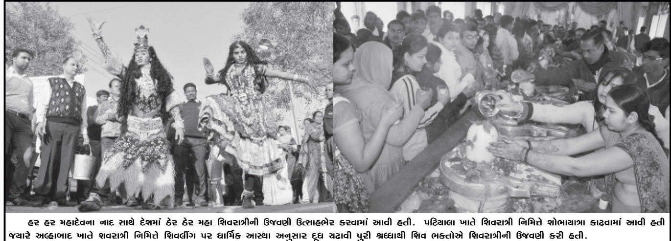
હર હર મહાદેવના નાદ સાથે દેશમાં હર હર મહા શિવરાત્રીની ઉજવણી ઉત્સાહભરે કરવામાં આવી હતી. પટિયાલા ખાતે શિવરાત્રી નિમિત્તે શોભાયાત્રા કાઢવામાં આવી હતી જ્યારે અલ્હાબાદ ખાતે શિવરાત્રી નિમિત્તે શિવલીંગ પર દાર્મિક આરથા અનુસાર દૂધ ચઢાવી પુરી શ્રદ્ધાથી શિવ ભક્તોએ શિવરાત્રીની ઉજવણી કરી હતી.