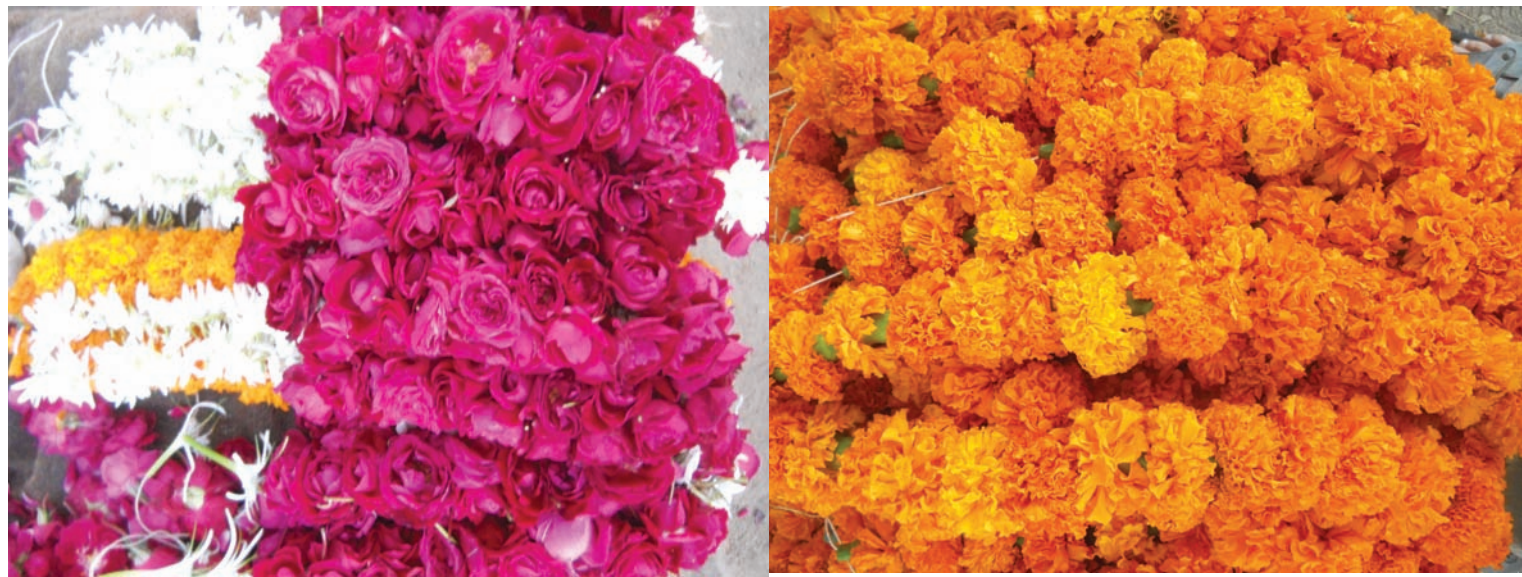
ગાંધીનગર શહેરમાં ઠેર ઠેર લગ્નોની મોસમ પુરબહારમાં શરૂ થવાની સાથે કુલોની કિંમત પરણ તેટલી જ છે... પૂજા હોય કે શુભપ્રસંગ કુલોની હાલમાં ડિમાંડ જોરમાં છે. દેશી ગુલાબના કુલ ૧૫૦ થી ૨૦૦ રૂપિયા કિલો છે જ્યારે ગલગોટાના કુલ ૫૦ રૂપિયા કિલો તેમજ વેણીના સફેદ કુલ ૧૦૦ રૂપિયા કિલો છે. અંગ્રેજી કુલ ૨૫ રૂપિયે ૧ નંગ છે. વેણી ૨ પથી શરૂ થઈ ૧૫૦ સુધીમાં વેચાઈ રહી છે...