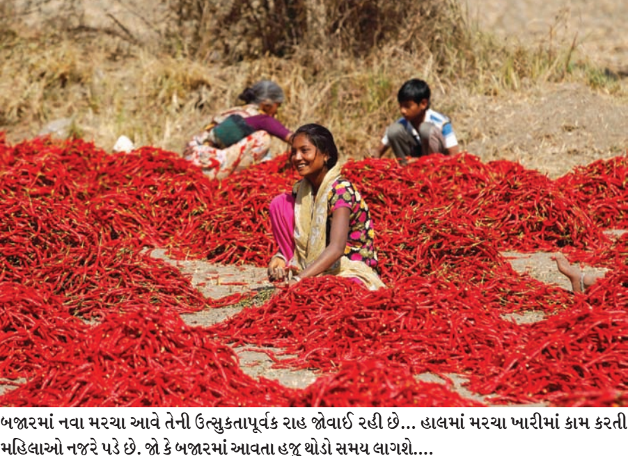
બજારમાં નવા મરચા આવે તેની ઉત્સુકતાપૂર્વક રાહ જોવાઈ રહી છે... હાલમાં મરચા ખારીમાં કામ કરતી મહિલાઓ નજરે પડે છે. જો કે બજારમાં આવતા હજુ થોડો સમય લાગશે....

જ્યારે વોશિંગ્ટન સુંદરે ૪૩ રન કર્યા હતા. એક વખતે નિરાશાજનક સ્થિતિમાં મુકાઈ ગયા બાદ ભારતીય ટીમો વાપસી કરી હતી.