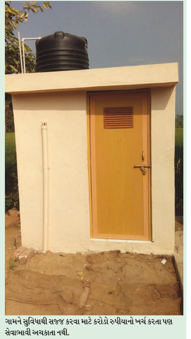
ગામને સુવિધાથી સજ્જ કરવા માટે કરોડો રુપીયાનો ખર્ચ કરતા પણ સેવાભાવી અચકતા નથી.

ગામમાં હોસ્પિટલ, આંગણવાડી, ઢોરને પાણી પીવા માટેની વ્યવસ્થા, સત્સંગ હોલ, મંદિર, સહિતની સુવિધાઓથી સજ્જ ઈસનપુર મોટા ગામની એકવાર મુલાકાત લેવા જેવી છે. સરકારી સહાય વિના