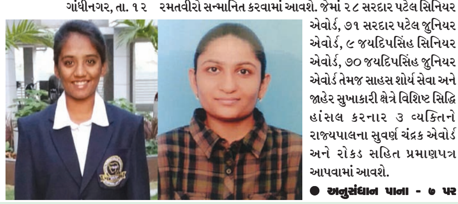
ગાંધીનગર, તા. ૧૨ રમતવીરો સન્માનિત કરવામાં આવશે. જેમાં ૨૮ સરદાર પટેલ સિનિયર એવોર્ડ, ૭૧ સરદાર પટેલ જુનિયર એવોર્ડ, ૯ જયદિપસિંહ સિનિયર એવોર્ડ, ૭૦ જયદિપસિંહ જુનિયર એવોર્ડ તેમજ સાહસ શોર્ચ સેવા અને જાહેર સુખાકારી ક્ષેત્રે વિશિષ્ટ સિદ્ધિ હાંસલ કરનાર ૩ વ્યક્તિને રાજ્યપાલના સુવર્ણ ચંદ્રક એવોર્ડ અને રોકડ સહિત પ્રમાણપત્ર આપવામાં આવશે.

રાજ્યના રમતગમત યુવા સાંસ્કૃતિક પ્રવૃત્તિ વિભાગ દ્વારા રમત ગમત ક્ષેત્રે ગુજરાતનું નામ રોશન કરનાર રમતવીરોને પ્રોત્સાહિત કરવા માટે સરદાર પટેલ સિનિયર જુનિયર, જયદિપસિંહ સિનિયર, જુનિયર અને સાહસ શોર્ચ સેવા એવોર્ડ આપવામાં આવે છે. આ વર્ષે પણ રાજ્ય સરકાર દ્વારા ઉત્કૃષ્ટ પ્રદર્શન કરનાર રાજ્યભરના કુલ ૧૭૮