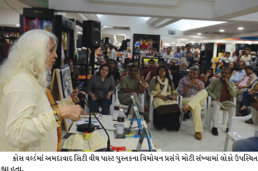
કોસ વર્લ્ડમાં અમદાવાદ સિટી વીથ પાસ્ટ પુસ્તકના વિમોચન પ્રસંગે મોટી સંખ્યામાં લોકો ઉપસ્થિત રહ્યા હતા.

બનાસકાંઠા જિલ્લાના વડગામ તાલુકાના પસવાદળ મુકામે શ્રી શકટામ્બિકા માતાજીના ૧૦૨મું પાટોત્સવની ભારે હર્ષ અને ભક્તિભર્યા માહોલમાં ધામધૂમથી ઉજવણી કરવામાં આવી હતી. આ પ્રસંગે હજારોની જનમેદનીએ ભક્તિભાવપૂર્વક માતાજીના દર્શન કરી આ મહાઅવસરના સહભાગી બન્યા હતા. આ પ્રસંગે માતાજીની શોભાયાત્રાનું સમગ્ર પસવાદળ ગામમાં પરિભ્રમણ કરવામાં આવ્યું હતું. માતાજીના પાટોત્સવ પ્રસંગે સમગ્ર પસવાદળ ગામમાં આનંદ, ઉત્સાહ અને ભક્તિનો ભવ્ય માહોલ ઇલાવ્યો હતો. ઉલ્લેખનીય છે કે શ્રી શકટામ્બિકા માતાજી ગૌતમ ગૌત્રના બ્રાહ્મણોની કુળદેવી હોવાથી સમગ્ર ગુજરાતમાંથી વિશાળ સંખ્યામાં માઈભક્તો દર્શનર્થે આવ્યા હતા.