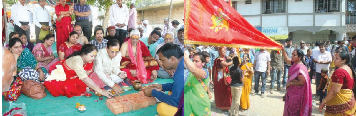
પસવાદળ ખાતે શકટામ્બિકા માતાજીનો પાટોત્સવ ધામધૂમપૂર્વક ચોખ્યો

આજે સવારે બનેલા બનાવના સંદર્ભમાં શાહરૂખ ખાને હજુ સુધી કોઈ પ્રતિક્રિયા આપી નથી. અગાઉ એવા અહેવાલ આવ્યા હતા કે, વિશ્વ હિન્દુ પરિષદ દ્વારા ગુજરાતમાં રઈસના ફિલ્મના શૂટિંગ વેળા વિરોધ કરાયો હતો. જિલ્લા કલેક્ટરની ઓફિસની બહાર પણ દેખાવો કરાયા હતા. આ ફિલ્મમાં નવાસુદીન સિદ્દીકી અને પાકિસ્તાની મૂળની અભિનેત્રી માહિરાની ભૂમિકા છે. આ ફિલ્મ ઈંદ ઉપર રજૂ કરવામાં આવનાર છે. અસહિષ્ણુતા મામલે શાહરૂખ ખાનને થોડાક સમય પહેલા કરેલા નિવેદન મુદ્દે છેલ્લા કેટલાક સમયથી વિરોધનો સામનો કરવો પડી રહ્યો છે.