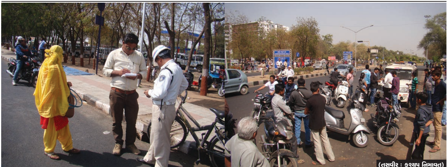
અવિરત હેલ્મેટ ઝુંબેશ - રવિવારે પણ હેલ્મેટ ઝુંબેશ યથાવત રહી હતી... ઘણા વાહન ચાલકોના મનમાં એમ હતું કે, રવિવારે હેલ્મેટ વિના ચાલશે... રજાના દિવસે કોણ પકડશે... પરંતુ ખૂબ મોટી સંખ્યામાં વાહન ચાલકો ખોટા પડ્યા અને શહેરના પ્રવેશ દ્વારા પર ગોઠવાયેલ ટ્રાફિક પોલીસે દોઢ હજારથી વાહન ચાલકોને હેલ્મેટ વિના પકડ્યા હતા અને દંડ ફટકાર્યો હતો...

ગાંધીનગર તા ૧૪ આગામી માર્ચ મહીનામાં ધોરણ-૧૦ અને ૧૨ ની બોર્ડ પરિક્ષાનુ આયોજન કરવામાં આવ્યું છે. ગુજરાત ઉચ્ચતર માધ્યમિક શિક્ષણ બોર્ડ દ્વારા લેવાનારી આ પરિક્ષાને અનુલક્ષી વિદ્યાર્થીઓએ આખા વર્ષની મહેનતનો નિયોડ રજુ કરવાનો હોવાથી પરિક્ષારીઓ તજજ્ઞો તેમજ ટેચરનો પણ ભોગ બનતા હતાશામાં ગરકાવ થઈ જાય છે. વિદ્યાર્થીઓને હતાશામાંથી ઉગારવા માટે શિક્ષણ બોર્ડ દ્વારા બાયસેગના માધ્યમથી તજજ્ઞો દ્વારા માર્ગદર્શન પુર પાડવા તા ૧૮ અને ૨૫ ફેબ્રુઆરીના રોજ કાર્યક્રમ યોજાશે. જય વસાવડા તેમજ કૃષ્ણકાન્ત