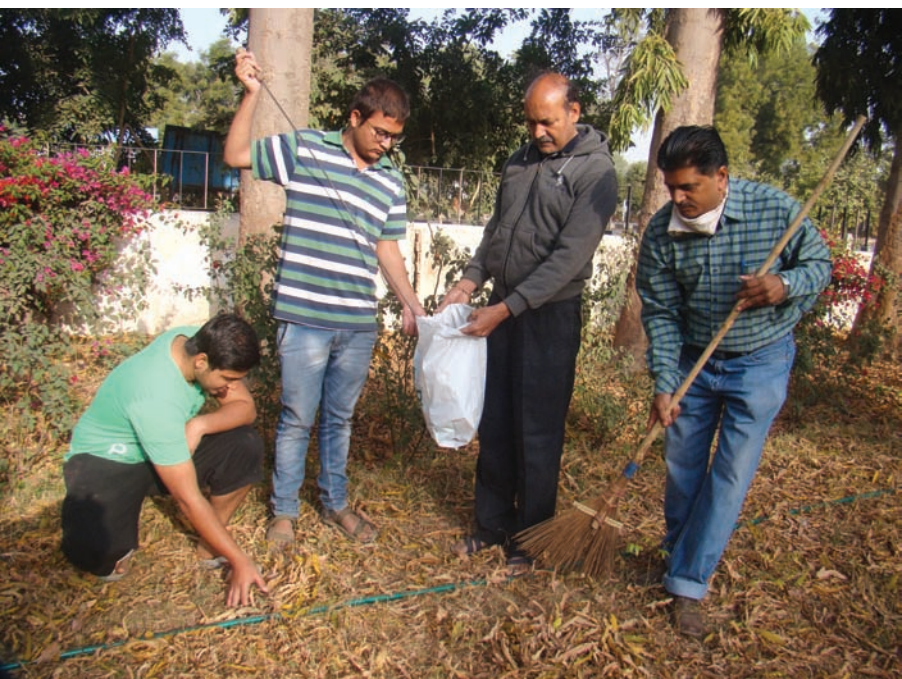
ગાંધીનગરમાં જ્યાં મોટાભાગના યુવાનો વેલેન્ટાઈન ડે મનાવવામાં મશગુલ હતા ત્યારે નેહરુ યુવા કેન્દ્રના કેટલાક યુવા કાર્યકર્તાઓએ સ્વચ્છતા અભિયાન હાથ ધર્યું હતું. આ અભિયાન અંતર્ગત તેમણે સે. ૧૬માં આવેલ યુથ હોસ્ટેલ કેમ્પસને ચોખ્ખુચણાંક બનાવી દીધું હતું.