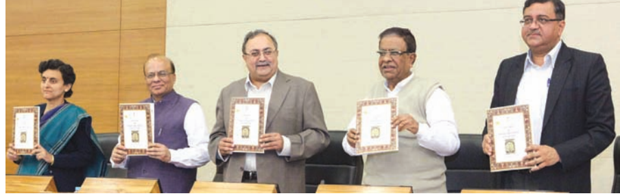
પ્રોત્સાહન આપવા આ ક્ષેત્રમાં કામ કરતાં લોકોનાં સામાજિક આર્થિક ઉત્થાન ઉપર ભાર મૂકી, પુરક તેમજ પરંપરાગત કલાની જીવંત વારસા તરીકે જાળવણી કરવાના હેતુસર મુખ્યમંત્રી આનંદીબેન

ગુજરાતમાં કુટિર અને રોજગારીની તકો ઉભી કરી, તેમના પટેલના માર્ગદર્શનમાં તૈયાર થયેલ ગ્રામોદ્યોગનાં વૃદ્ધિ અને વિકાસ માટે જીવનની ગણવત્તામાં સુધારો કરવા નવી કુટિર અને ગ્રામોદ્યોગ નીતિ