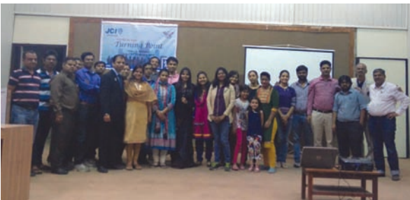
ખાતે તા. ૨૧મી ફેબ્રુઆરીના રોજ રાત્રે ૮ કલાકે લાઈફ ચેજિંગ સેમિનાર 'ટર્નિંગ પોઈન્ટ'નું આયોજન કરાયું હતું.

ગાંધીનગર, તા. ૨૨ ગાંધીનગરની જૂનિયર ચેમ્બર ઈન્ટરનેશનલ દ્વારા સે. ૧૭માં સ્ટાફ ટ્રેનિંગ કોલેજ