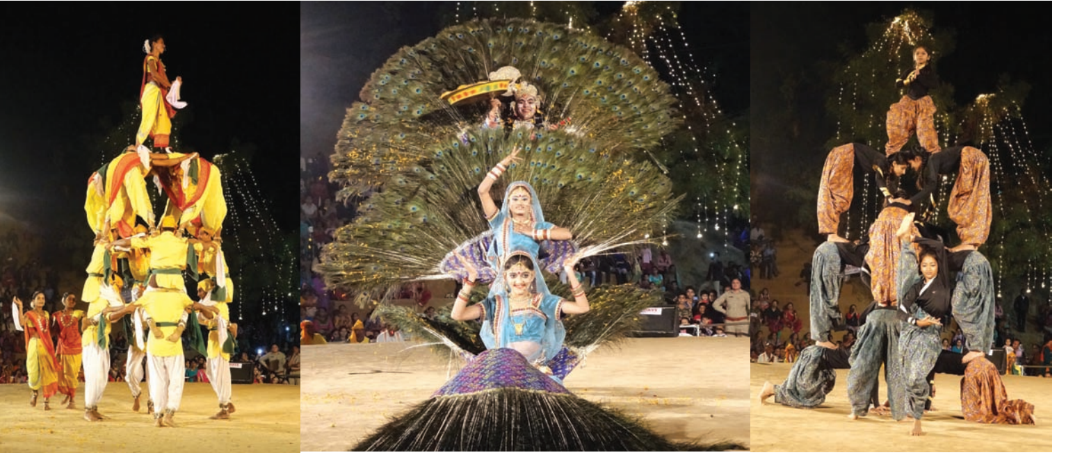
વસંતોત્સવની જમાવટ - સંસ્કૃતિ કુંજમાં વિવિધ રાજ્યોના લોકનૃત્યોની પ્રસ્તુતિએ વસંતોત્સવમાં જમાવટ કરી છે....

ગાંધીનગર, તા. ૨૩ ૨/૩ બહુમતી પ્રાપ્ત કરી ગાંધીનગર તાલુકાની પેથાપુર નગરપાલિકાના રવિવારે યોજાયેલા મતદાન પછી આજે હાથ ધરાયેલ મતગણતરીમાં ભાજપે તેનો કબ્જો જાળવી રાખ્યો છે. આજે સવારે સે. ૧૫ ખાતે શરૂ થયેલી મતગણતરીમાં વોર્ડ નં. ૧ માં બે બેઠકો કોંગ્રેસને મળતાં રસાકસી ભયાં પરિણામ આવશે તેવું લાગતું હતું. પરંતુ વોર્ડ ૨, ૩, ૪, ૫ માં ભાજપની આખેઆખી પેનલોએ વિજય મેળવ્યો હતો. વોર્ડ નં. ૬માં કોંગ્રેસે ભાજપની કલીન સ્વીપને અટકાવી હતી અને ચારેય બેઠકો પર કોંગ્રેસના ઉમેદવારો વિજયી બન્યા હતા. ૭૫ ટકા જેટલું ભારે મતદાન થતાં બન્ને પક્ષોએ વિજયના દાવા મતદાન પછી વ્યક્ત કર્યા હતા. જોકે આજની મતગણતરીમાં ભાજપનો ભગવો લહેરાયો હતો. એક જ કલાકમાં મતગણતરીનું કાર્ય સંપન્ન થઈ જવા પામ્યું હતું.