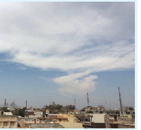
ચારેક દિવસથી પલટાયેલા વાતાવરણ વચ્ચે ઠંડીનું પ્રમાણ ઘટતા દિવસ દરમિયાન લોકોને ગરમીનો અહેસાસ થઈ રહ્યો છે. જાણે ઉનાળાની ધીમા પગલે શરૂઆત થઈ ચુકી છે તેવું માનતા પ્રજાજોનેને કુદરતે ફરીથી ચક્રમાં આપતા હવામાને કરવટ બદલતાં બંને જિલ્લામાં વાદળો સતત ઘેરાઈ આવતા જિલ્લાના પ્રજાજનોને બે ઋતુનો અનુભવ છે ત્યારે વરસાદની સંભાવના પેદા થતા ખેડૂતોના માથે ચિંતાની લકીરો બેંચાઈ છે. અરવલ્લી-સાબરકાંઠા જિલ્લામાં સતત વાદળછાયા વાતાવરણથી બંને જિલ્લાના પ્રજાજનોમાં શરદી-ખાંસી, ગળાનો દુખાવો, તાવ જેવી વાઈરલ બિમારીઓ વધતા તેમને તબીબી સારવાર લેવાની ફરજ પડી રહી છે.

મોડાસા, તા. ૨૪ ઉત્તર ગુજરાતમાં અપરએર સાયકલોનીક સરકયુલેશનની અસરથી અરવલ્લી-સાબરકાંઠાના જિલ્લાઓમાં હવામાને કરવટ બદલતાં આકાશ વાદળો ઘેરાઈ આવ્યા હતા અને વાતાવરણમાં ઠંડક પ્રસરી ગઈ હતી. જેનાથી ખેતીને નુકશાનની ભીતી તેમજ રોગચાળાની દહેશત વર્તાઈ રહી છે. અરવલ્લી-સાબરકાંઠા જિલ્લામાં છેલ્લા થઈ રહ્યો છે. સતત વાદળો ઘેરાયેલા રહેતા માવઠાની સદભાવના દેખાતા શિયાળુ ખેતપેદાશો જેવી કે ઘઉં, જીરૂ, વરીયાળી, તડબૂચ જેવા પાકોમાં રોગચાળો ફાટી નીકળવાની દહેશત ડોકતા બંને જિલ્લાના ભૂમિપુત્રો ચિંતીત બન્યા છે. ચોમાસામાં વરસાદની અનિયમિતતાના લીધે અને કપાસના પોષણશક્તિ ભાવો ન મળતા ખેડૂતોની હાલત કફોડી બની હતી ત્યારે શિયાળાની ઋતુ પૂર્ણ થવાના આરે