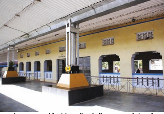
ઉત્તર ગુજરાતમાં રેલવેને લગતી અનેકવિધ સમસ્યાઓ છે ત્યારે ચાલુ વર્ષે બજેટમાં સરકાર આ સમસ્યાઓનું નિરાકરણ લાવે તેવી માંગ ઉઠી છે.