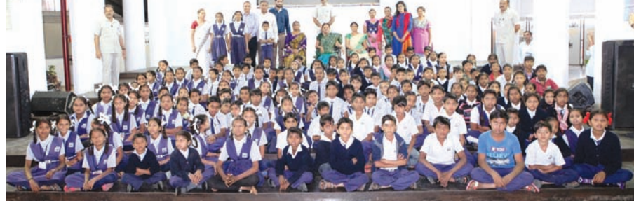
મુખ્યમંત્રી શ્રીમતી આનંદીબહેન પટેલની આજે ગુજરાત વિધાનસભામાં અમદાવાદની આનંદ નિકેતન શાળા તથા ગાંધીનગર જિલ્લાના ભાટ-હુડકો ભાટ પ્રાથમિક શાળાના બાળકોએ મુલાકાત લીધી હતી. આ બાળકો આજે વિધાનગૃહની કામગીરી જોવા શૈક્ષણિક પ્રવાસ હેતુસર ગાંધીનગર આવ્યા હતા. આનંદીબહેને આ બાળકો સાથે વિધાનગૃહ, સંસદીય પ્રણાલિ અને લોકશાહી વ્યવસ્થામાં નાગરિકશાસ્ત્ર વિષયક બાબતો અંગે વાર્તાલાપ કર્યો હતો.

ગાંધીનગર, તા. ૨૬ યોગ એન્ડ કલ્ચરલ એસોસિએશન ઓફ ગુજરાત અને યોગ કોન્ફેડરેશન ઓફ ઈન્ડીયાના સંયુક્ત ઉપક્રમે આગામી તા. ૨૮મી ફેબ્રુઆરીના રોજ સવારે ૧૦.૦૦ કલાકે અડાલજ સ્થિત ત્રિમંદિર સંકુલના દાદાનગર હોલ ખાતે નેશનલ યોગાસન સ્પોર્ટ્સ યેમ્પિયનશીપ-૨૦૧૬ નું આયોજન કરવામાં આવ્યું છે. આ રાષ્ટ્રીય કક્ષાની યોગાસન સ્પર્ધામાં દેશભરમાંથી લગભગ ૧૬ થી ૧૮ રાજ્યના સ્પર્ધકો ભાગ લેશે. આ યોગ સ્પર્ધા અંતર્ગત તા. ૨૭મી ફેબ્રુઆરીના રોજ ઉપસ્થિત બધા રાજ્યના યોગ એસોસિએશનના પદાધિકારીઓની મીટીંગ યોજાશે. જેમાં રાષ્ટ્રીય કક્ષાએ યોગની રમતનું નેતૃત્વ કરવા માટેની ચર્ચા વિચારણા કરવામાં આવશે. આ નેશનલ યોગાસન સ્પોર્ટ્સ યેમ્પિયનશીપ ૨૦૧૬ માં રસ ધરાવનાર ભાઈ-બહેનોને એસોસિએશનના વાર્ષિક પ્રેસીડન્ટ મહેન્દ્ર ત્રિવેદીએ હાજર રહેવા અનુરોધ કર્યો છે.