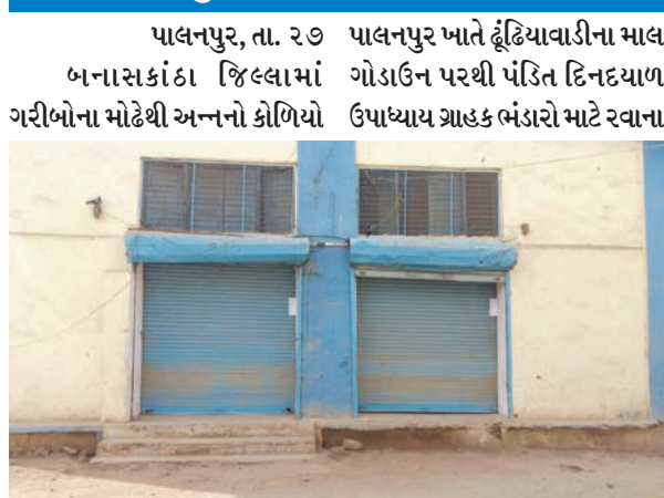
ઘઉંની લેતા કાળાબજારીયા બેઠામાં કરાઈ રહેલ રેશનીંગના પુરવઠામાં બન્યાં છે. હજુ તો ડિસેમ્બર માસમાં રસીદ હોવા છતાં ચોખાની બોરીઓ

ઘઉં-ચોખા-ખાંડ સાથેની રસીદો વાળી ટ્રકમાં માત્ર ઘઉંનો જ પુરવઠો : ગોડાઉન સીલ કરાયું : તપાસની મંથરગતિએ કાળાબજારરિયાઓને મોકળુ મેદાન આપ્યું