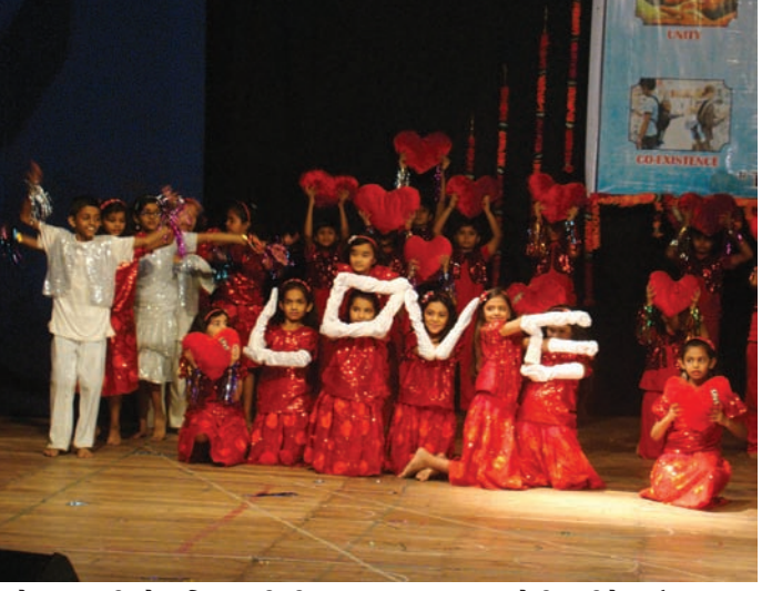
અંદાજમાં રજૂ કરી હતી અને ઉપસ્થિત અતિથિઓ તથા વાલીઓનાં દિલ જીતી લીધાં હતાં. નાનાં ભૂલકાઓથી માંડીને હાઈસ્કૂલ કક્ષા સુધીના વિદ્યાર્થીઓએ આ વાર્ષિકોત્સવ અંતર્ગત પોતાના કલા કૌશલનાં દર્શન કરાવ્યાં હતાં.