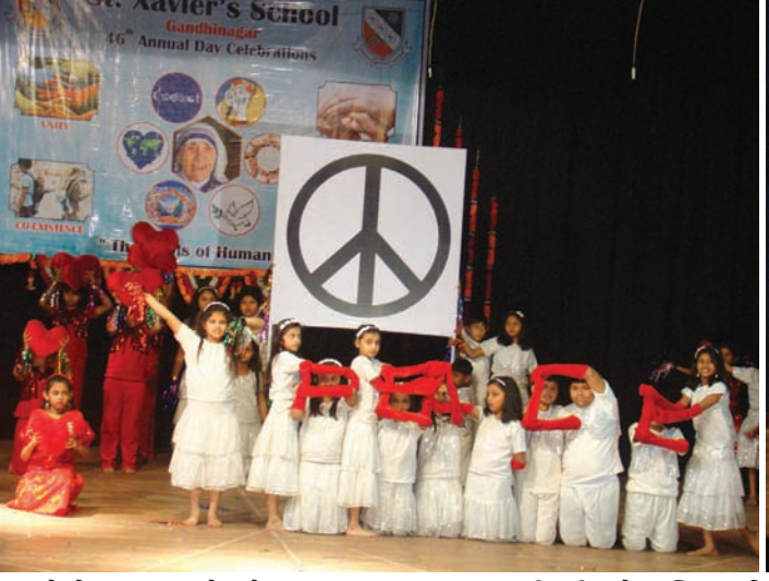
અંદાજમાં રજૂ કરી હતી અને ઉપસ્થિત અતિથિઓ તથા વાલીઓનાં દિલ જીતી લીધાં હતાં. નાનાં ભૂલકાઓથી માંડીને હાઈસ્કૂલ કક્ષા સુધીના વિદ્યાર્થીઓએ આ વાર્ષિકોત્સવ અંતર્ગત પોતાના કલા કૌશલનાં દર્શન કરાવ્યાં હતાં.