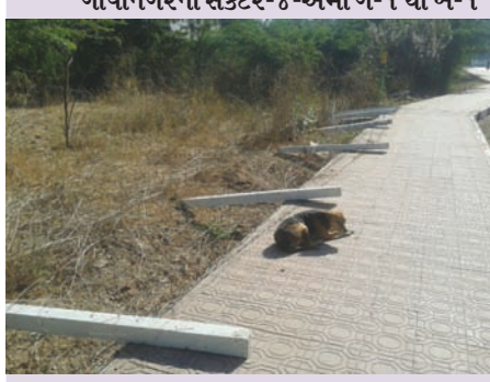
તરફ જવાના માર્ગે વૃક્ષોની જાળવણી માટે કરાયેલ ફેન્સિંગ તાજેતરમાં જ તુટી જવા પામી છે. આ તુટેલી ફેન્સિંગની જાણ તંત્રને કરી દેવામાં આવી હોવા છતાં તે પ્રત્યે તંત્ર બેદરકારી દાખવી રહ્યું હોવાનું આ વિસ્તારના રહીશોનું