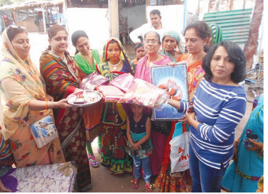
સૌરાષ્ટ્ર કચ્છ સેવા સમાજ મહિલા પાંખ દ્વારા ભોજિય, ચટ્ટેડી, સે-રહના છાપરામાં રહેલી જરૂરિયાતમંદ દિકરીને લગ્નપ્રસંગે ચણિયાચોળી, ૨ સાડી, દિવાલ ઘડીયાળ, દુલ્હન શણગાર, સોનાની ચુંક, ચાંદીના ગણપતિ જેવી વસ્તુઓ આપી હતી. આગામી દિવસોમાં પણ આવી ગરીબ દિકરીઓને વસ્તુઓ આપવામાં આવશે.