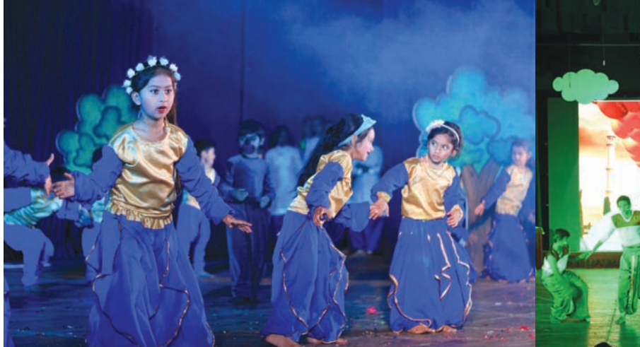
ન્યુ ગાંધીનગરના કુડાસણ વિસ્તારની સ્વામિનારાયણ ધામ ઈન્ટરનેશનલ સ્કૂલનો ૧૦મો વાર્ષિકોત્સવ તાજેતરમાં ટાઉનહોલ ખાતે ઉજવાયો હતો. ખૂબ જ ધામધૂમથી ઉજવાયેલા આ વાર્ષિકોત્સવમાં શાળાની દરેક પાંખના વિદ્યાર્થીઓએ મોટી સંખ્યામાં ભાગ લઈ વિવિધ મનમોહક સાંસ્કૃતિક કાર્યક્રમો રજુ કર્યા હતા. આ કાર્યક્રમોમાં દેશભક્તિના ગીતો તથા નૃત્યો, લોકનૃત્યો, દિલધડક કરતબ, વેસ્ટન ડાન્સ, મીમીકી, વકતુત્વ, ટેલેન્ટ શો જેવી અનેકવિધ કૃતિઓને રજુ કરતા બાળકોને જોઈ હોલમાં ઉપસ્થિત વાલીગણ તથા આમંત્રિતો દંગ થઈ ગયા હતા. કાર્યક્રમની સફળતા માટે તમામ પાંખના સંચાલકગણે ભારે જહેમત ઉઠાવી હતી. અર્કદરે આ કાર્યક્રમને બાળકો, વિદ્યાર્થીઓ, વાલીઓ તથા શાળા સંચાલક તમામ મન ભરીને માણ્યો હતો.