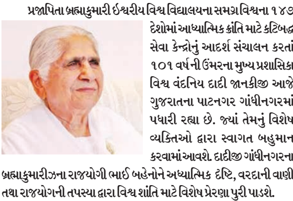
બ્રહ્માકુમારીજના રાજયોગી ભાઈ બહેનોને અધ્યાત્મિક દૃષ્ટિ, વરદાની વાણી તથા રાજયોગની તપસ્યા દ્વારા વિશ્વ શાંતિ માટે વિશેષ પ્રેરણા પુરી પાડશે.

ગુજરાતમાં પ્રતિ વર્ષ આશરે ૨૫ હજાર કેન્સર દર્દીઓ મોતને ભેટે છે : ગુજરાતમાં નોંધાતા કેન્સરના કેસોમાં સૌથી વધુ તમાકુ યાવવાને કારણે થતા મોંઠાના કેન્સરના દર્દીઓ : ગ્રામીણ મહિલાઓ અને બાળકોમાં પણ 'પડીકા' યાવવાનો વધતો કેડ 'ઘાતક' સાબિત થશે