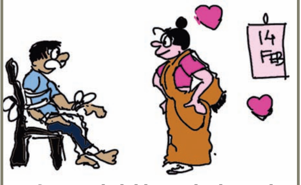
કિયર... કાલે તો વેલેન્ટાઈન ડે પુરો થઈ જશે... કાલ તો બહાર જવા દઈશને...??