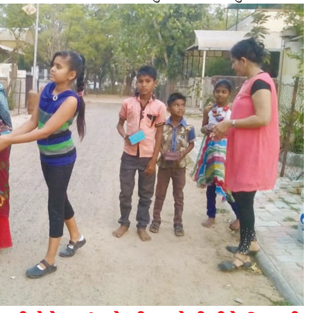
શ્રમિકોને કુડ પેકેટ આપી વેલેન્ટાઈન ડે ની અનોખી રીતે ઉજવણી

સમસ્ત ગુજરાત પ્રજાપતિ યુવક મંડળ દ્વારા ૨૬મો જીવનસાથી પસંદગી મેળો આયોજન આગામી તા. ૨૬ માર્ચને રવિવારના રોજ બપોરે ૨ કલાકે સાબમતી રીવરફ્રન્ટ બ્લોક એ, ઈવેન્ટ સેન્ટર, ટાગોર હોલ પાછળ પાલડી અમદાવાદ ખાતે યોજાશે. આ પસંદગી મેળામાં ગુજરાત કે ગુજરાત બહારના પ્રજાપતિ સમાજના યુવક-યુવતિઓ ભાગ લઈ શકશે. જેમાં કુંવારા, વિધવા, વિધુર, ત્યક્તા, છુટાછેડા સહિત સારીરિક ખોડખાંપણ ધરાવતા લગ્ન ઈચ્છુક ઉમેદવારો ભાગ લઈ શકશે. આ મેળામાં ભાગ લેવા ઈચ્છતા પ્રજાપતિ સમાજના યુવક-યુવતિઓએ આગામી તા. ૧૦-૩-૧૭ સુધીમાં ભરીને ૧૫, વિરાટ કોમ્પ્લેક્સ સતાધાર બીઆરટીએસ બસ સ્ટેન્ડ પાસે સોલારોડ ઘાટલોડીયા ખાતે જમા કરાવવાનું રહેશે. આ નિ:શુલ્ક જીવનસાથી પસંદગી મેળામાં ભાગ લઈ સફળ બનાવવા પ્રજાપતિ યુવક મંડળ દ્વારા અનુરોધ કરાયો છે.