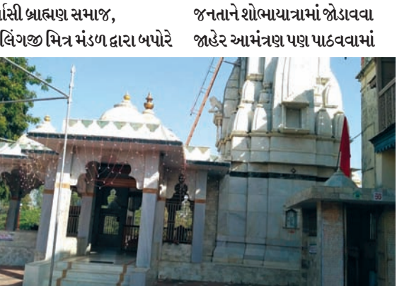
યૌર્વાસી બ્રાહ્મણ સમાજ, એકલિંગજી મિત્ર મંડળ દ્વારા બપોરે જનતાને શોભાયાત્રામાં જોડાવા જાહેર આમંત્રણ પણ પાઠવવામાં આવે છે અને રાત્રિ દરમિયાન કાશી વિશ્વનાથ મહાદેવ મંદિરમાં ભજન-કીર્તન અને લોકઝાપરાનું પણ આયોજન કરવામાં આવેલ છે.

બીલીપત્રના અભિષેક બાદ શિવજી તેના પર પ્રસન્ન થઈ તેને વરદાન આપ્યું હતું કે તેને તે એક શિકારીમાંથી સંત બની ગયો. અહીં વાત છે શિવજીની આરાધના કરી શિવકૃપા પ્રાપ્ત કરવાની, અરવલ્લી જિલ્લાના મોડાસા શહેરમાં માઝુમ નદીના કિનારે આવેલ અતિપ્રાચીન શ્રી કાશીવિશ્વનાથ મહાદેવ મંદિર જે ઘણા વર્ષોથી અહીં સ્થિત છે. આજે મહાશિવરાત્રિના દિવસે ખુબ ધામધૂમથી ભજન, કીર્તન સાથે ઉજવણી કરવામાં આવે છે. દર વર્ષની જેમ આ વર્ષે પણ મોડાસા