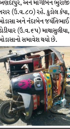
મોડાસા તાલુકાના સાકરીયા નજીક કારની ટક્કરે રીક્ષામાં બેઠેલ પાંચ મહિલાઓ સહિત આઠ વ્યક્તિઓ ઘવાતા તમામ ઈજાગ્રસ્તોને સારવાર માટે મોડાસાની સાર્વજનિક હોસ્પિટલમાં ખસેડવામાં આવ્યા હતા.

સામેની બાજુએથી આવતી રીક્ષાને ટક્કરતા અકસ્માત સર્જાયો હતો. જેમાં રીક્ષામાં બેઠેલ પાંચ મહિલાઓ સહિત આઠ જેટલી વ્યક્તિઓને શરીરે ઓછા-વત્તી ઈજાઓ થવા પામી હતી. આ તમામ ઈજાગ્રસ્તોને ૧૦૮ ઈમરજન્સી સેવા ધ્વારા મોડાસાની સાર્વજનિક હોસ્પિટલમાં સારવાર માટે ખસેડવામાં આવી જેમાંથી એક મહિલાની હાલત વધુ ગંભીર હોવાનું જાણવા મળ્યું છે. જ્યારે કારનો ચાલક અકસ્માત સર્જી ત્યાંથી નાસી છુટ્યો હતો.