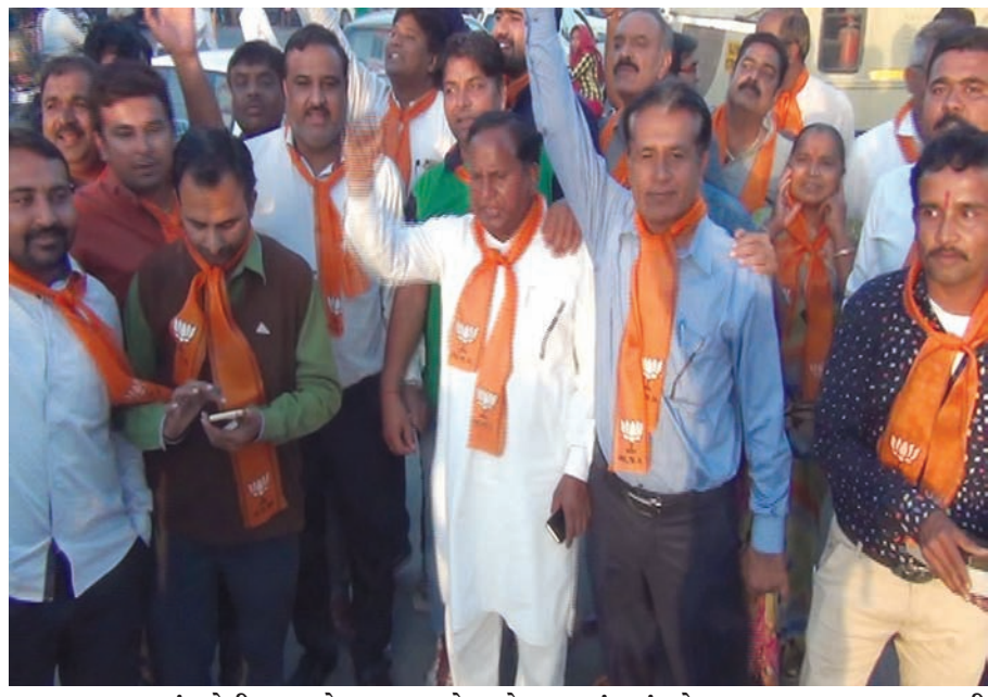
મહારાષ્ટ્રમાં મળેલી ભાજપને જીતના પગલે આજે બનાસકાંઠામાં શહેર ભાજપ દ્વારા આતશબાજી કરી જીતની ખુશી માનવના નજરે પડ્યા હતા. પાલનપુરમાં ભાજપી ટેકેદારો તેમજ સમર્થકો દ્વારા આજે ગુરુનાનક ચોક ખાતે મોટી સંખ્યામાં એકઠા થઈ ફટકાડા તેમજ મીઠાઈ વહેંચી જીતની એકબીજાને વધામણી આપી હતી. આ પ્રસંગે ભાજપના મોટા ભાગના નેતા તેમજ સમર્થકોએ ભાજપની જીત એ એક ઐતિહાસિક જીત ગણાવી આવનારા સમય માટે ભારતને વિશ્વ ગુરુ બનાવવા માટે જરૂરી પગલું ગણાવ્યું હતું.