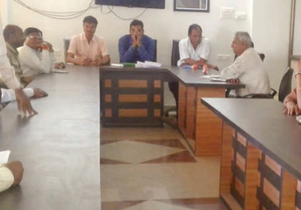
પ્રમુખ સહિત એક કોર્પોરેટર તથા એક અપક્ષ કોર્પોરેટર સહિત કુલ ત્રણ સભ્યો ઉપસ્થિત રહેતાં

પકડ્યું હતું ત્યારે તા. ૨૨/૨/૨૦૧૭ને બુધવારના રોજ યોજાતા મીટીંગ પહેલાં બાયડ અને તલોદ જેવી સ્થિતિ પકડ્યું હતું ત્યારે તા. ૨૨/૨/૨૦૧૭ને બુધવારના રોજ યોજાતા મીટીંગ પહેલાં બાયડ અને તલોદ જેવી સ્થિતિ પકડ્યું હતું ત્યારે તા. ૨૨/૨/૨૦૧૭ને બુધવારના રોજ યોજાતા મીટીંગ પહેલાં બાયડ અને તલોદ જેવી સ્થિતિ પકડ્યું હતું ત્યારે તા. ૨૨/૨/૨૦૧૭ને બુધવારના રોજ યોજાતા મીટીંગ પહેલાં બાયડ અને તલોદ જેવી સ્થિતિ