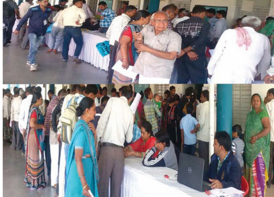
તલોદ તાલુકાના ખેરોલ ખાતે યોજાયેલ સેવાસેતુ કાર્યક્રમનો લાભ પંથકના ડઝનબંધ ગામોના અરજદારોએ લીધો હતો. અહીં કુલ ૮૪૪ અરજીઓ આવી હતી. જેમાંથી ૮૩૩ અરજીઓનો નીકાલ થયો હતો. જેમાં મામલતદાર, તા.પં. અને ગ્રા. પં. સહિત તંત્ર કામે લાગી ગયું હતું.