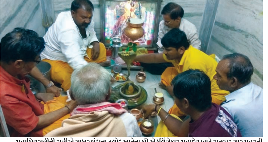
મહાશિવરાત્રીની રાત્રીએ સાબરકાંઠાના તલોદ ખાતેના શ્રી એકલિંગેશ્વર મહાદેવ ખાતે રાતભર ચાર પ્રહરની પૂજા કરવામાં આવી હતી. શિવભક્તોએ અહીં વિધિ-વિધાન મુજબ મહાપૂજા કરી હતી. જેનો લાભ સંખ્યાબંધ દર્શનાર્થીઓએ લીધો હતો.

વધુમાં જાનનગર જિલ્લાના સલાયા, ઓખા, મીડાપુર તરફથી ઘણા યાત્રાળુઓ ઊંઝા નજીકના ઉનાવા ગામે આવેલ મીરાંદાતારની દરગાહે દર્શનાર્થે આવતા હોય છે. ત્યારે આ યાત્રાળુઓને પણ ઉનાવા આવવા માટે સીધી કોઈ જ એસ.ટી. બસ મળતી નથી. આમ ઊંઝાથી સૌરાષ્ટ્રના દારકા, ઓખા જવા માટે વર્ષોથી કોઈ જ સીધી એસ.ટી. બસ સેવા ઉપલબ્ધ ન હોઈ મુસાફરોને તૂટક તૂટક રીતે મુસાફરી કરવાની ફરજ પડે છે. ત્યારે મહેસાણા એસ.ટી. વિભાગના સત્તાધિશોએ મુસાફરોની વ્યાજબી માંગણીને ધ્યાનમાં લઈને સત્વરે ઊંઝાથી દારકા યા ઓખા સુધીની નવિન બસ સર્વિસ શરૂ કરવી જરૂરી છે.