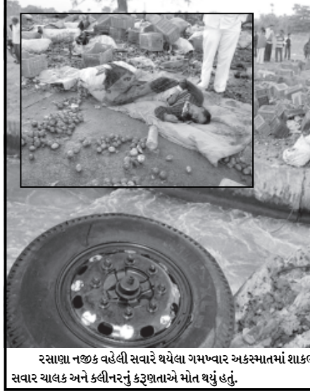
રસાણા નજીક વહેલી સવારે થયેલા ગમખાવર અકસ્માતમાં શાકભાજીની ટ્રક કેનાલમાં પડીખાતા તેમાં સવાર ચાલક અને ક્લીનરનું કુરૂણાતો મોત થયું હતું.