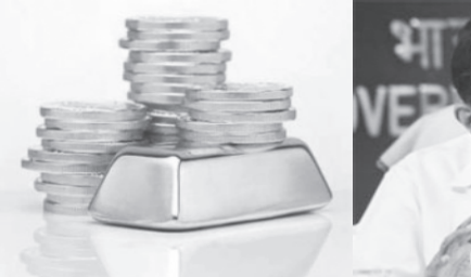
આસપાસ રહી હતી. એક વર્ષ ડોલર નોંધાઈ છે. આ ઘટાડો જાન્યુઆરી અને માર્ચ ૨૦૧૨માં સરકાર દ્વારા સોનાની આયાત પર તત્કાલિન નાણાં મંત્રી પ્રણવ મુખર્જીએ સ્ટાન્ડર્ડ ગોલ્ડ ઉપર બેઝિક કસ્ટમ ડ્યુટી બે ગણી કરી

૨૦૧૧-૧૨ના નાણાંકીય વર્ષ માટે સોનાની આયાત ૫૬.૨ અબજ ડોલરની કસ્ટમ ડ્યુટીમાં વધારાના અનુસંધાનમાં થયો છે. બજેટમાં દીપ્તી હતી સાથે સાથે નોન સ્ટાન્ડર્ડ ગોલ્ડ ઉપર આને ૧૦ ટકા કરી દેવામાં આવી હતી. તત્કાલિન નાણાં મંત્રીએ અનુશ્રાન્ડ જ્વેલરી ઉપર એક ટકા એક્સાઈઝ ડ્યુટી પણ લાદી હતી. જો કે દેશભરમાં જ્વેલર્સ તરફથી ભારે હોબાળો થયા બાદ આને પરત ખેંચી લેવામાં આવી હતી. હાલમાં સરકાર ઈક્વિટી અને અન્ય નાણાંકીય સંસ્થાઓમાં નાણાં નાખવાના પ્રયાસો કરી રહી છે. વર્ષ ૨૦૧૧-૧૨ના નાણાંકીય વર્ષમાં સીએડી જીડીપીના ૪.૨ ટકાની આસપાસ રહેતા આનો ફાયદો થયો હતો.