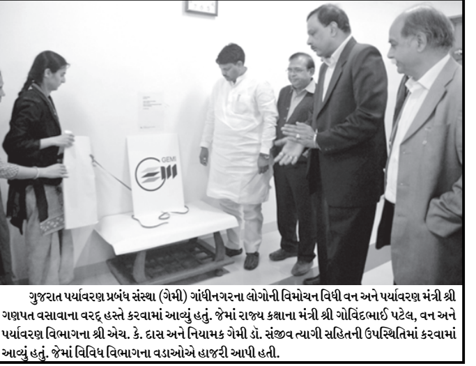
ગુજરાત પર્યાવરણ પ્રબંધ સંસ્થા (ગેમી) ગાંધીનગરના લોગોની વિમોચન વિધી વન અને પર્યાવરણ મંત્રી શ્રી ગણપત વસવાના વરદ હસ્તે કરવામાં આવ્યું હતું. જેમાં રાજ્ય કક્ષાના મંત્રી શ્રી ગોવિંદભાઈ પટેલ, વન અને પર્યાવરણ વિભાગના શ્રી એચ. કે. દાસ અને નિયામક ગેમી ડૉ. સંજીવ ત્યાગી સહિતની ઉપસ્થિતિમાં કરવામાં આવ્યું હતું. જેમાં વિવિધ વિભાગના દાસ્યોએ હાજરી આપી હતી.

ખેડા જિલ્લાના નડીયાદમાં સંત અન્ના હાઈસ્કૂલ નજીક આજે સવારે પોણા ચાર વાગ્યાના સુમારે રસ્તાની બાજુમાંથી પસાર થતી જીએસપીસી કંપનીની ગેસલાઈનમાંથી ગેસ લીકેજ થતાં આગ ભભૂકી ઉઠી હતી. આગને કારણે રસ્તા ઉપર મુકવા પાન બીડીના બેગલવા તથા નજીકમાં પાર્ક કરેલું પલસર મોટર બાઈક ઝપટમાં આવી ગયું હતું. અને ત્રણ ભસ્મીભૂત થઈ ગયા હતા. આગમાં એક મહિલા દાડી જતાં તેને નડિયાદની સ્થાનિક હોસ્પિટલમાં દાખલ કરવામાં આવી હતી. જો કે ફાયરબ્રિગેડના ફાઈટરો લઈને જવાનો વસી આવ્યા હતા અને પાણીનો મારો ચલાવી આગને લગભગ પોણો કલાકમાં કબ્બમાં લઈ લીધી હતી.