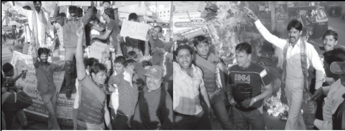
ડીસામાં વિશ્વ હિન્દુ પરીષદ અને બજરંગ દળે તાજેતરમાં જ પાકિસ્તાન સૈનિકો દ્વારા એક માસ અગાઉ અપહરણ કરાયેલા શીખ યુવકના શીરોચ્છેદ મામલાની ફૂર ઘટનાનો તીવ્ર વિરોધ નોંધાવ્યો હતો અને આજે સાંજે ૫ કલાકે ડીસાના કુવારા સર્કલ પાસે શહીદીને સાચી શ્રદ્ધાંજલી આપી પાકિસ્તાન સામે પોતાનો રોષ ઠાલવી ઉગ્ર સુગ્રોચ્ચાર કરી પાકિસ્તાનનો રાષ્ટ્રધ્વજ જાહેરમાં સળગાવ્યો હતો. ગુજરાત સહીત દેશ ભરમાં આ સંવેદન સીલ ઘટનાના ઘેરા પ્રત્યાઘાતો પડ્યા છે. અને દેર-દેર પાકિસ્તાન સરકારના અમાનવીય કૃત્યનો રોષપૂર્વક વિરોધ થઈ રહ્યો છે ત્યારે પાકિસ્તાનના રાષ્ટ્રીય ધ્વજને સળગાવી વિશ્વ હિન્દુ પરીષદ ડીસા અને બજરંગ દળે અસલ હિન્દુત્વની લહેર ડીસા સહીત જીલ્લા ભરમાં વહેતી કરી છે. આ બનાવથી સમગ્ર બનાસકાંઠા જીલ્લા પોલીસ હાઈ એલર્ટ પર આવેલ છે.