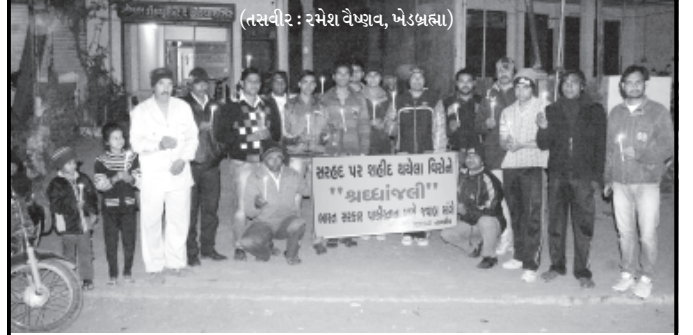
ભારત-પાકિસ્તાનની અંકુશ રેખા પર પાકિસ્તાની ટુકડી દ્વારા બે ભારતીય જવાનની હત્યા કરવામાં આવી હતી જે સંદર્ભે બે પ્રશ્નઠામાં આજે યુવાનો દ્વારા મીણબત્તી પ્રગટાવી મૌન પાળી શ્રદ્ધાંજલિ આપવામાં આવી હતી.

મહેસાણા, તા. ૧૦ દર વર્ષની જેમ થાયુ વર્ષે પણ ૧લી જાન્યુ.થી મહેસાણા જિલ્લામાં માર્ગ સલામતી સમાહની ઉજવણી શરૂ થયેલ છે. પરંતુ આ ઉજવણી દરમિયાન માર્ગ નિવારણ માટે જે અસરકારક કામગીરી થવી જોઈએ તે ન થતાં આ ઉજવણી ફરસરૂપ બની રહે છે તેવો લોકમત પ્રવર્તે છે. દર વર્ષે જાન્યુઆરીના પ્રથમ સપ્તાહમાં માર્ગ સલામતી સમાહની ઉજવણી થાય છે. જેનો મુખ્ય ઉદ્દેશ્ય રસ્તાઓનો ઉપયોગ કરનાર વાહન માલિકો, ડ્રાઈવરો તથા અન્ય લોકોને જોઈએ તે લેવાતા નથી. જિલ્લામાં પોલીસ અને આર.ટી.ઓ.ના અધિકારીઓની સામી છાતીએથી રોજિંદા કેટલાય બાનગી વાહનોમાં ગેરકાયદે અમથિત મુસાફરોની એકબીજા સ્થળે હેરાફેરી થઈ રહી છે. આવા વાહનોની સામે જૂજ પગલાં ભરાય છે પરંતુ ખાસ કોઈ અસરકારક પગલાં ભરતાં નથી. જિલ્લામાં છેલ્લાય કેટલાય સમયથી માર્ગ અકસ્માતોનું પ્રમાણ વધી રહ્યું છે. ગોઝારા અકસ્માતોમાં કેટલીયે માનવ જીવોનો હોમાય છે અને કેટલાય ઘાયલ થયા છે.