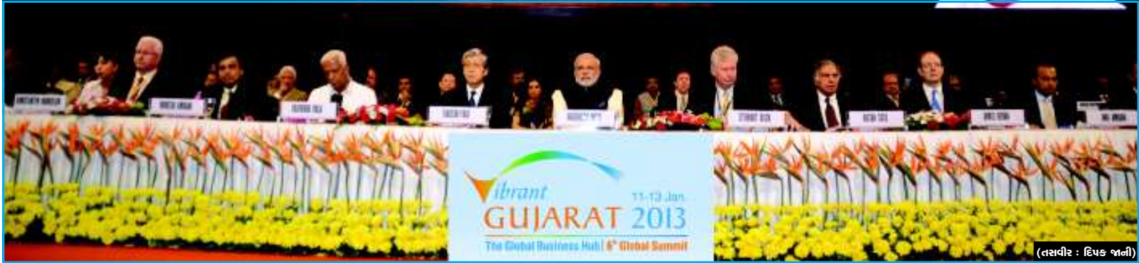
(તસવીર : દિપક જાની)