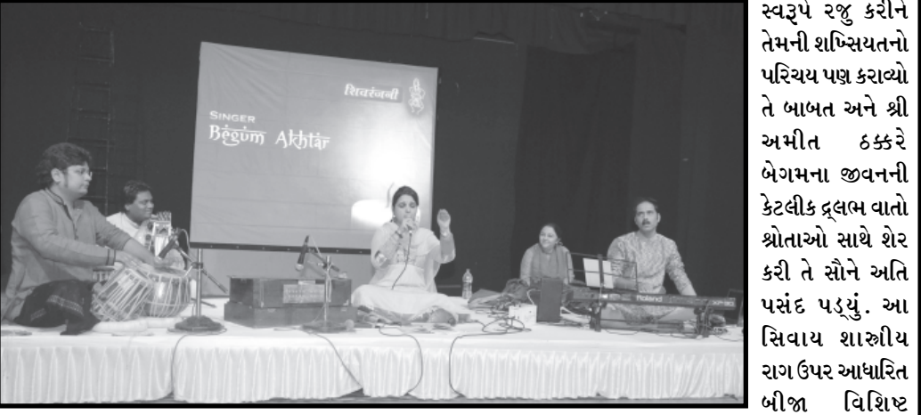
શિવરંજનીની પ્રસંશતીય પહેલ રસસ્વાદ