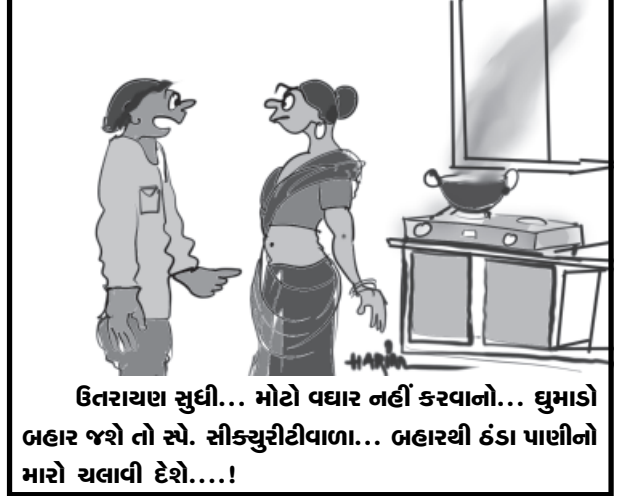
ઉતરાચલ સુધી... મોટો વધાર નહીં કરવાનો... ઘુમાડો બહાર જશે તો સ્ત્રી. સીકચુરીટીવાળા... બહારથી ઠંડા પાણીનો મારો ચલાવી દેશે....!