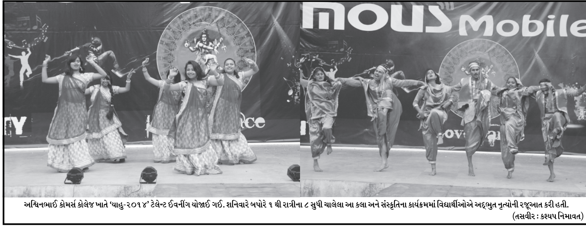
અધિનભાઈ કોમર્સ કોલેજ ખાતે 'ધાહુ-૨૦૧૪' ટેલેન્ટ ઈવનીંગ યોજાઈ ગઈ. શનિવારે બપોરે ૧ થી રાત્રીના ૮ સુધી ચાલેલા આ કલા અને સંસ્કૃતિના કાર્યક્રમમાં વિદ્યાર્થીઓએ અદ્ભુત નૃત્યોની રજૂઆત કરી હતી.