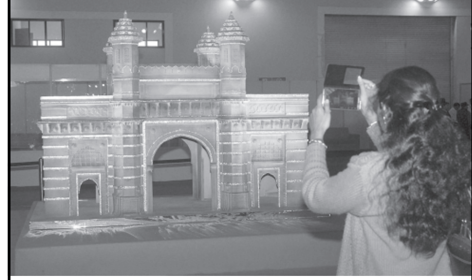
એક જવેલરી પ્રદર્શનમાં હિરા જડિત સોનાથી બનાવેલા ગેટ વે ઓફ ઈન્ડિયા એ મુલાકાતીઓમાં ભારે આકર્ષણ જમાવ્યું હતું.

કોલકાતા, તા. ૪ બિહારમાં ટ્યુરિસ્ટ હબ તરીકે ગણાતા બોધગયામાં પારો ગામમાં જાપાની એક વિદ્યાર્થીની ઉપર મહિના સુધી બળાત્કાર ગુજારવાના સંદર્ભમાં પાંચ લોકોની ઘરપકડ કરવામાં આવી છે. બોધગયામાં આશરે એક મહિના સુધી તેને બાનમાં પકડી રાખીને તેના ઉપર અત્યાચાર ગુજારવામાં આવ્યો હતો. ૨૨ વર્ષીય જાપાની ટ્યુરિસ્ટ કોલકાતામાં સૌથી પહેલા પહોંચી હતી જ્યાં તેના કેટલાક મિત્રો પણ રહેલા છે. બેંદૂકની અણીએ આ ગેંગે રેપ ગુજારવામાં આવ્યો હતો. બનાવને લઈને ભારે ખળભળાટ મચી ગયો હતો. ડિસેમ્બર મહિનામાં આ બનાવ બન્યો હતો પરંતુ કોલકાતા પોલીસની ટીમ અને બોધગયા પોલીસની ટીમને હવે અપરાધીઓને પકડી પાડવામાં સફળતા મળી છે. પાંચ શસ્ત્રોને પકડી પાડવામાં આવ્યા છે. ૨૦મી નવેમ્બરના દિવસે આ જાપાની વિદ્યાર્થીની આવી હતી તે સુધર ખાતેની એક હોટલમાં રોકાઈ હતી. ૧૨મી નવેમ્બરના દિવસે આ વિદ્યાર્થીની પોસ્ટેલવાક શાખા પહોંચ્યા હતા. ટુર ગાઈડ બનીને આ શાખા પહોંચ્યા હતા. બોધગયાથી શાખાના સંજ્ઞામાંથી જાપાની મહિલા આખરે છુટીને વારાણસી પહોંચી હતી જ્યાં તે કેટલાક જાપાની પ્રવાસી મિત્રોને મળી હતી અને તેમની મદદથી કોલકાતામાં સંપર્ક થયો હતો.