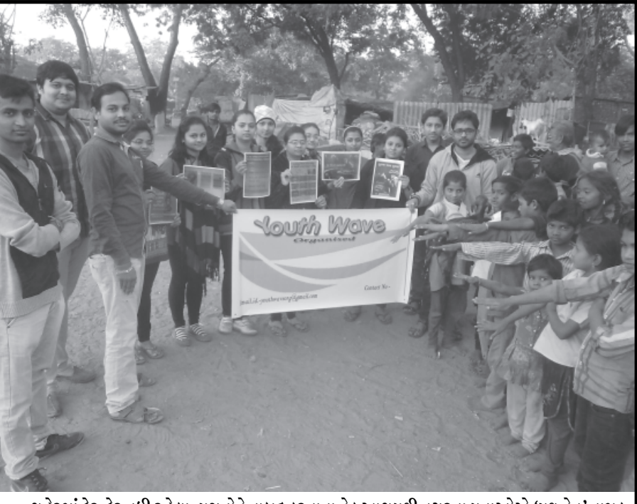
શહેરમાં ઠેર-ઠેર વધી રહેલા વ્યસનોને નાબૂદ કરવાના નેક આશયથી નગરના યુવાઓએ 'યુથ વેવ' નામક સંસ્થા દ્વારા સેક્ટર-૨૮ પાસે ઝુંપડપટ્ટી વિસ્તારમાં રહેતા શ્રમિકોને તમાકુ, સિગારેટ, દારૂ તેમજ વિવિધ પ્રકારના વ્યસનોથી દૂર રહેવા ચિત્રો દ્વારા સમજ આપવામાં આવી હતી. તેમજ જીવનમાં હંમેશા વ્યસનથી દૂર રહી બીજાને પણ આ ભયાનક દૂષણોથી દૂર રહેવા શપથ લેવાડાયા હતા.

ગુજરાત સાહિત્ય અકાદમી દ્વારા ગુજરાતી ભાષામાં નવોદિત વાર્તાકારોને માર્ગદર્શન મળે તે માટે તા. ૬ થી ૮ જાન્યુઆરી દરમિયાન ત્રિદિવસીય નવોદિત વાર્તાલેખન કાર્ય શિબિરનું આયોજન કરવામાં આવ્યું છે. આ કાર્ય શિબિર ગાંધીનગર ઈન્ટરનેશનલ પબ્લિક સ્કૂલ ખાતે યોજાશે. જેમાં જાણીતા વાર્તાકાર અને વાર્તા માસિક 'મમતા' ના સંપાદક મધુરાય ઉપસ્થિત રહેશે. આ શિબિર માટે ૨૮ જેટલા નવોદિત વાર્તાકારોને પસંદ કરવામાં આવેલ છે. આ ઉપરાંત શિબિરમાં મહેમાન વક્તા તરીકે તા. ૬ થી જાન્યુઆરીએ જાણીતા વાર્તાકારો ડિરિટ દુધાત અને બિપીન પટેલ, તા. ૭ થી જાન્યુઆરીએ મોહન પરમાર તેમજ તા. ૮ થી જાન્યુઆરીએ પત્રા ત્રિવેદી ઉપસ્થિત રહેશે.