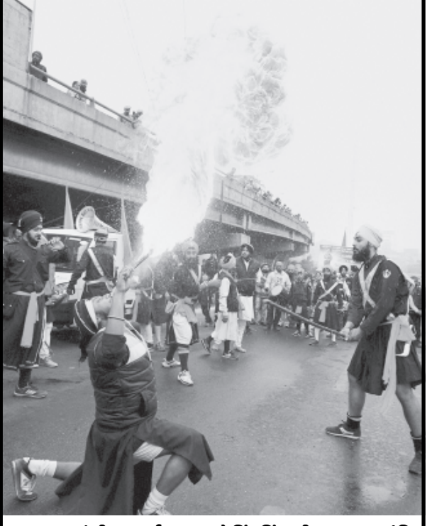
૧૦માં જીમ ધર્મ ગુરૂ ગોવિંદસિંહની જન્મ વર્ષાંતિ પ્રસંગે ચોળાચેલ ધાર્મિક કાર્યક્રમમાં શ્રદ્ધાળુઓએ દિલ ઘડક કરતબો દેખાડ્યા હતાં.

જે જેથી રેલયાત્રા મોંઘી બની શકે છે. એનડીએ સરકાર બીજી વખત બજેટ રજૂ કરવા જઈ રહ્યું છે જેમાં લોકપ્રિય જાહેરાતો કરવામાં આવશે નહીં. રેલવેની સુરક્ષા અને યાત્રીઓને વધુ સુવિધા આપવા ઉપર આમા મુખ્ય ધ્યાન આપવામાં આવશે. સુરેશ પ્રભુ બિઝનેસ લક્ષી બજેટને લઈને આશાવાદી બનેલા છે. રેલવે ભવનમાં હવાલો સંભાળી લીધાના બે મહિનાની અંદર જ તેઓએ રેલવેની નાણાકીય સ્થિતિને સુધારવા સાત કમિટિઓની રચના કરી ચુક્યા છે જેમાં પારદર્શકતા લાવવા, મહેસુલી આવક ઉભી કરવા અને ભારતીય રેલવેના માળખાને વધુ વ્યવસ્થિત કરવાની બાબતનો સમાવેશ થાય છે. મોટા રેલવે પ્રોજેક્ટની જાહેરાત પહેલાથી જ કરવામાં આવી ચુકી છે. આ પ્રોજેક્ટોમાં નાણા કોઈ અડચણરૂપ બનશે નહીં તેવી જાહેરાત પણ થઈ ચુકી છે. સરકાર પ્રવર્તમાન પ્રોજેક્ટોને પૂર્ણ કરવામાં વ્યસ્ત છે. ફંડની અછત કોઈ તકલીફરૂપ નથી. રેલવે મંત્રાલય દ્વારા ઈન્ડસ્ટ્રી ચેમ્બર ફિક્કી, એસોસિએશન, સીઆઈએસ અને અન્ય સંસ્થાઓ તરફથી અભિપ્રાય મેળવી