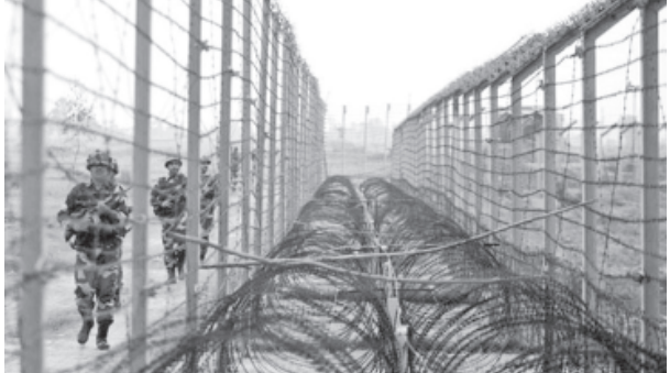
ગોળીબાર શરૂ કરવામાં આવ્યો હતો જેવાનોએ જોરદાર જવાબી કાર્યવાહી

દ્વારા સતત ગોળીબાર કરવામાં આવી રહ્યો છે. વર્ષ ૨૦૧૪માં કુલ ૫૫૦ વખત યુદ્ધવિરામના ભંગ બાદ નવા વર્ષમાં પણ છેલ્લા ત્રણ જ દિવસમાં ચાર વખત યુદ્ધ વિરામનો ભંગ કરવામાં આવ્યો હતો. સંરક્ષણ પ્રવક્તા કનલ એસડી ગોસ્વામીએ કહ્યું છે કે, ભારત અને પાકિસ્તાનના સૈનિકો વચ્ચે અંકુશ રેખા અને આંતરરાષ્ટ્રીય સરહદ ઉપર સતત સામસામે ગોળીબાર થઈ રહ્યો છે. ગોળીબારના કારણે ૩૨ હજાર લોકોને તેમના ઘર છોડી દેવાની ફરજ પડી છે.