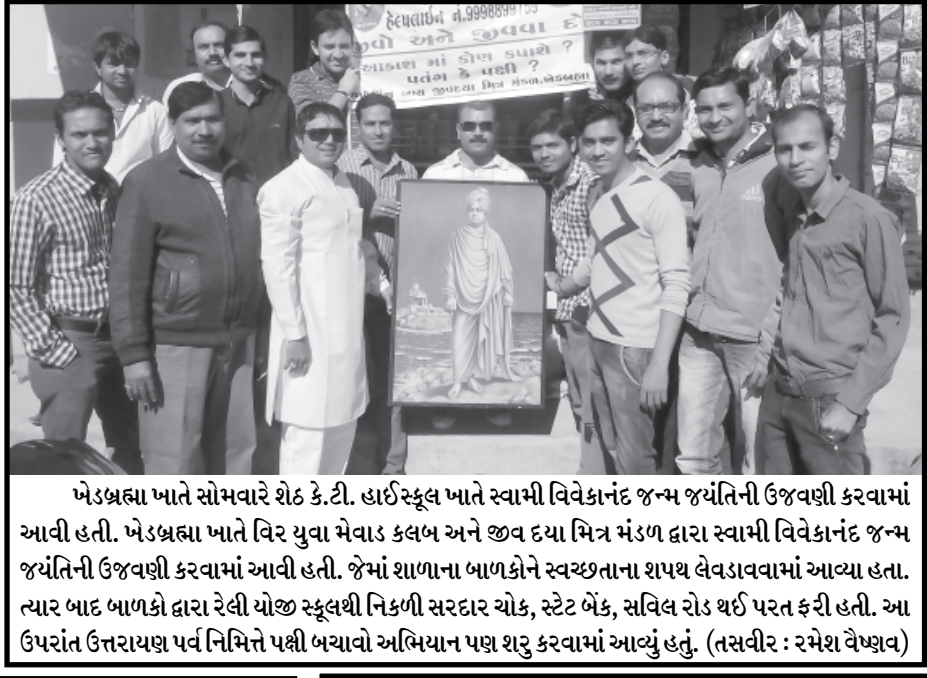
ખેડબ્રહ્મા ખાતે સોમવારે શેઠ કે.ટી. હાઈસ્કૂલ ખાતે સ્વામી વિવેકાનંદ જન્મ જયંતિની ઉજવણી કરવામાં આવી હતી. ખેડબ્રહ્મા ખાતે વિર યુવા મેવાડ કલબ અને જીવ દયા મિત્ર મંડળ દ્વારા સ્વામી વિવેકાનંદ જન્મ જયંતિની ઉજવણી કરવામાં આવી હતી. જેમાં શાળાના બાળકોને સ્વચ્છતાના શપથ લેવાડાવવામાં આવ્યા હતા. ત્યાર બાદ બાળકો દ્વારા રેલી યોજી સ્કૂલથી નિકળી સરદાર ચોક, સ્ટેટ બેંક, સવિલ રોડ થઈ પરત ફરી હતી. આ ઉપરાંત ઉત્તરાયણ પર્વ નિમિત્તે પશ્ચીમ બચાવો અભિયાન પણ શરુ કરવામાં આવ્યું હતું.