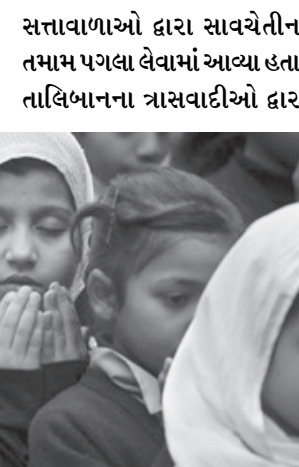
સત્તાવાળાઓ દ્વારા સાવચેતીના તમામ પગલા લેવામાં આવ્યા હતા. તાલિબાનના ત્રાસવાદીઓ દ્વારા મોતને ઘાટ ઉતારી દીધા હતા.

પેશાવર, તા. ૧૨ પાકિસ્તાનમાં પેશાવર આર્મી સ્કુલમાં ૧૬મી ડિસેમ્બરના દિવસે સત્તાવાળાઓ દ્વારા સાવચેતીના તમામ પગલા લેવામાં આવ્યા હતા. તાલિબાનના ત્રાસવાદીઓ દ્વારા મોતને ઘાટ ઉતારી દીધા હતા. ૧૦૭થી વધુ સ્કૂલી બાળકોને મોતને ઘાટ ઉતારી દેવામાં આવ્યા બાદ સેનાએ ઓપરેશન પાર પાડીને તમામ આતંકવાદીઓને મોતને ઘાટ ઉતારી દીધા હતા. આ આતંકવાદી હુમલામાં આશરે ૨૦૦થી વધુ વિદ્યાર્થી ધાયલ થયા હતા. પાકિસ્તાનમાં તાજેતરના સમયમાં સૌથી મોટા હુમલા તરીકે આને ગણવામાં આવે છે. અંતે ઉલ્લેખીય છે કે પાકિસ્તાનના પેશાવરમાં ૧૬મી ડિસેમ્બરના દિવસે આર્મી સ્કૂલમાં આતંકવાદીઓએ ભારે રક્તપાત સર્જીને શિક્ષકો અને વિદ્યાર્થીઓ સહિત ૧૦૭થી વધુને મોતને ઘાટ ઉતારી દેતા સનસનાટી મચી ગઈ હતી. તાલિબાની ત્રાસવાદીઓએ પાકિસ્તાનની આર્મી સ્કૂલમાં અંધાધૂંધ ગોળીબાર અને બોંબ બ્લાસ્ટ કરીને સ્કૂલી બાળકોને મોતને ઘાટ ઉતારી દીધા હતા. આ આતંકવાદી હુમલામાં આશરે ૨૦૦થી વધુ વિદ્યાર્થી ધાયલ થયા હતા. પાકિસ્તાનમાં તાજેતરના સમયમાં સૌથી મોટા હુમલા તરીકે આને ગણવામાં આવે છે.