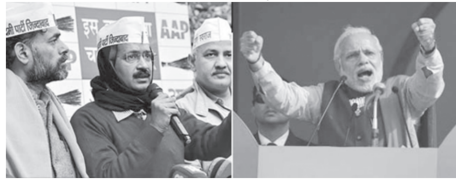
દિલ્હીમાં ઉમેદવારી દાખલ કરવાની છેલ્લી તારીખ ૨૧મી જાન્યુઆરી

શે. આની સાથે જ ચૂંટણી પ્રક્રિયાની વિધિવતરીતે શરૂઆત થશે. રામવામાં આવી છે જ્યારે ચક્રાસણી માટેની પ્રક્રિયા ૨૨મી જાન્યુઆરીના જાન્યુઆરી રહેશે. દિલ્હીમાં કુલ મતદારોની સંખ્યા ૧.૩ કરોડ રહેશે