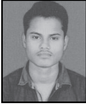
(જીનેન્દ્ર પટેલ ધવારા)