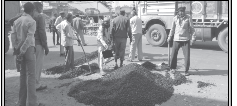
અધિક કલેક્ટર અને પોલીસ અધિકારીઓ ની સમજાવટ ના પગલે સમગ્ર ગ્રામજનો એ રોડ પર થી હટી જઈ ટ્રાફિક ને પુનઃચાલુ કરવામાં આવ્યો હતો અને આર.એન્ડ.બી વિભાગ ધવારા તાત્કાલીક ધોરણે બમ્પ બનાવવાની કામગીર શરૂ કરવામાં આવી હતી.

આજ રોજ ધનસુરા ખાતે આવેલ ચાર રસ્તા ઉપર ટ્રક ની અડફેટે ધો-૧૨ માં ભણતા બે વિદ્યાર્થીઓ નુ મોત નીપજ્યુ હતુ જે ઘટના ને પગલે ધનસુરા ગ્રામજનો રોડ ઉપર ઉતરી આવ્યા હતા અને ચાર કલાક સુધી સમગ્ર રોડ ને બમ્પ બનાવવાની માંગણી લઈ ને સમગ્ર હાઈવે ને ચાર કલાક સુધી ચક્રાજામ કરી દેવામાં આવ્યુ હતા ત્યારે